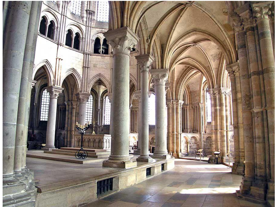
Внутреннее убранство храма в романском стиле