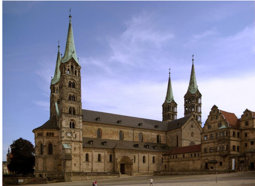
Бамбергский кафедральный собор Святого Петра и Святого Георгия, Германия

Архитектура романского стиля преимущественно церковная.