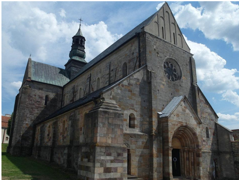
Храм в романском стиле в Польше

Романское искусство находилось под сильным влиянием византийского.