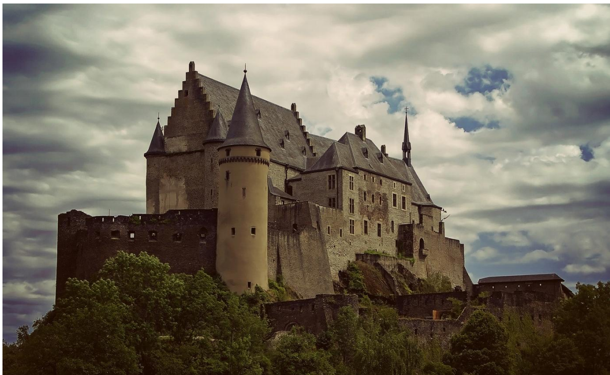
Замок Вианден в Люксембурге

Такие здания чаще всего возвышались над местностью, что упрощало оборону.