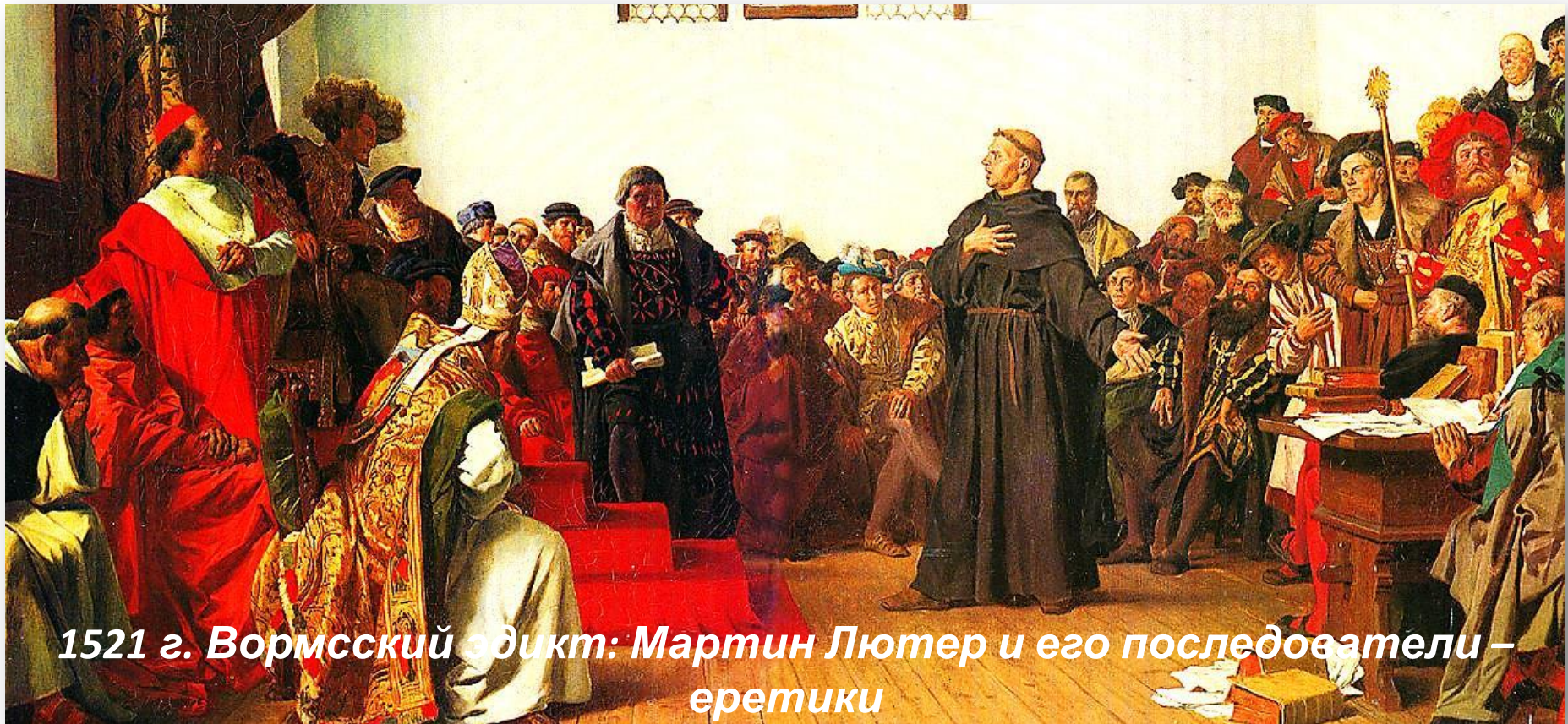
1521 г. Вормсский эдикт: Мартин Лютер и его последователи – еретики

Император Священной Римской империи Карл V потребовал, чтобы Лютер отрёкся от своего учения и подчинился папе, но получил отказ. Лютер произнёс свои знаменитые слова: «На этом я стою. И не могу иначе. Бог поможет мне. Аминь».