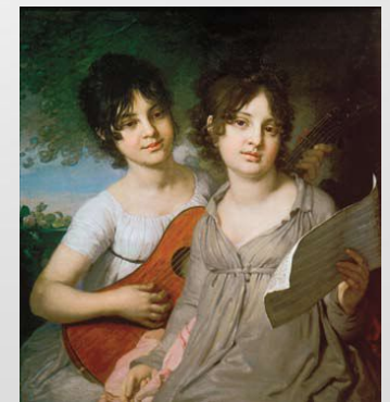
В. Боровиковский. Портрет сестер Гагариных