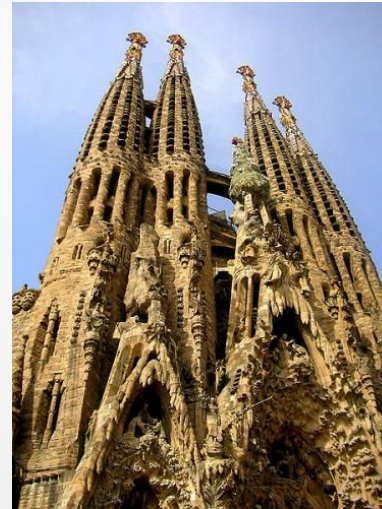
А. Гауди Собор Святого Семейства Испания (Барселона)