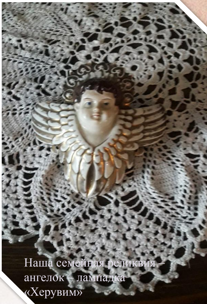
Наша семейная реликвия – ангелок – лампадка «Херувим»

Ангелок белый, блестящий, просвечивающийся. Он гладкий и прочный, в нем нет пористости.