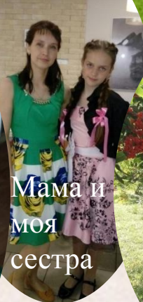
Мама и моя сестра