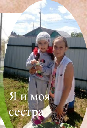
Я и моя сестра