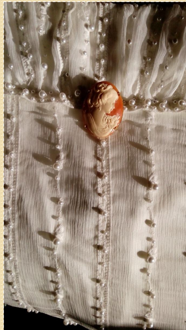
С. Сухорученко. Платье на период 1804 – 1806 гг. Фрагмент декора. 2017 г.