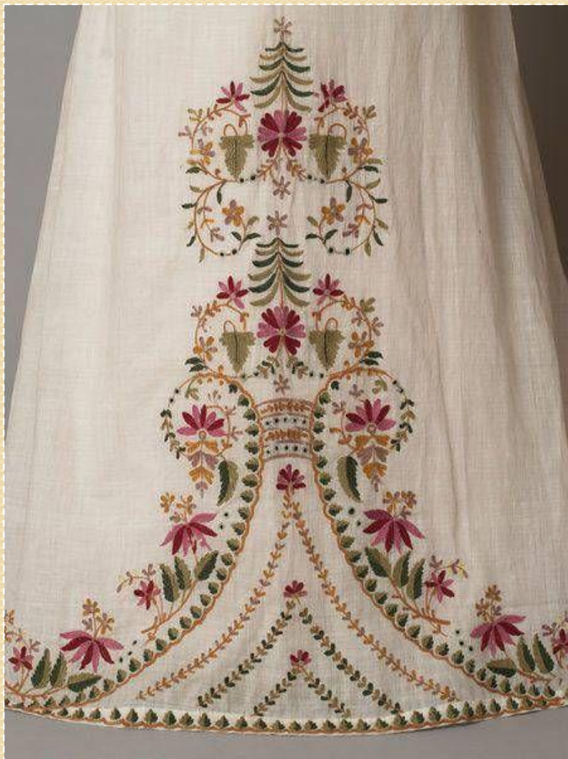
Платье из белого муслина. 1810-е гг. Фрагмент вышивки. Музей Виктории и Альберта