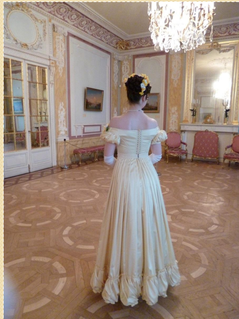
С. Сухорученко. Платье из желтого атласа на период 1820-х гг. 2012 г.