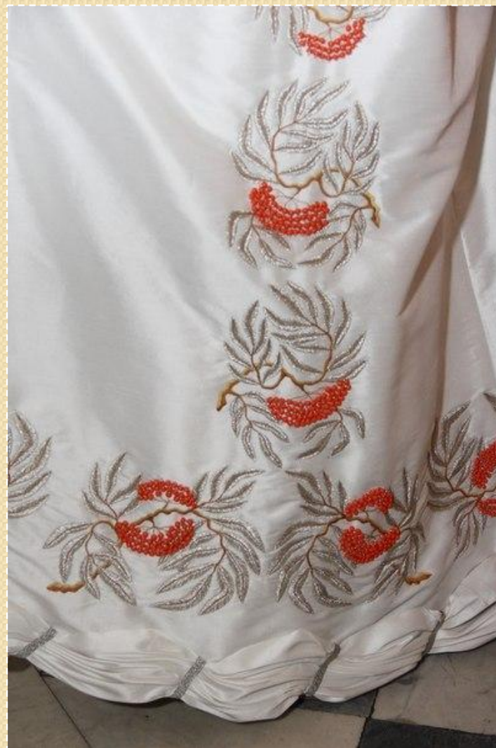
С. Сухорученко. Платье из белой тафты на период 1820-х гг. 2014 г.