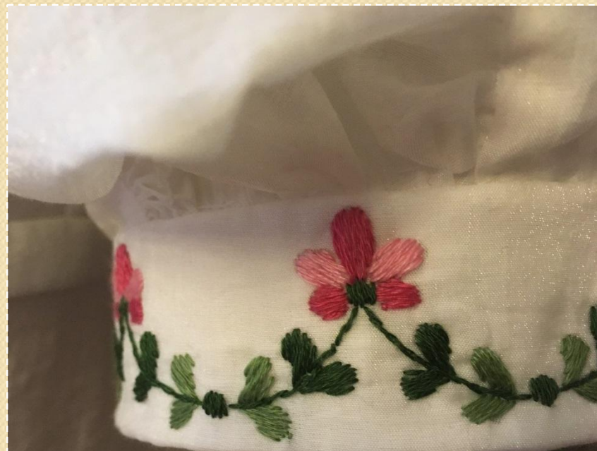
С. Сухорученко. Платье из белого батиста. Детали. 2018 г.