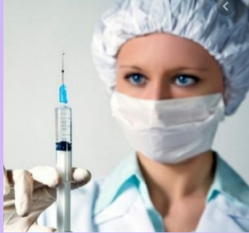
Виктория ангел хранитель всего живого в цирке до тех пор пока ей окончательно не сорвут нервы и она не свалит