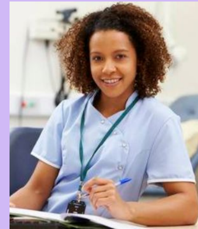
Нана - пришла вместо Виктории спасти вам жизнь и научить как платить налоги и наверное еще каши сварить.