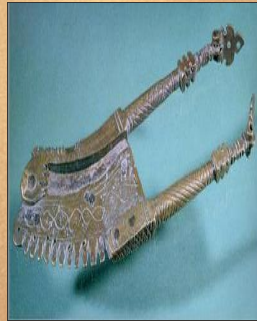
Ножницы для срезания плодов. Индия. 18 в.