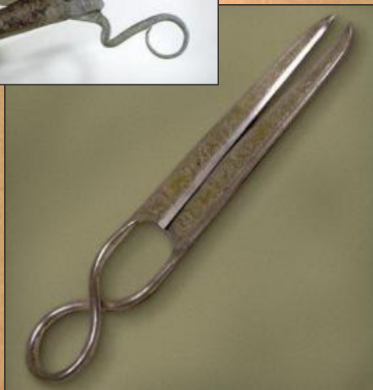
Династия Танг (618 – 907 гг.). 7 – 9 вв.