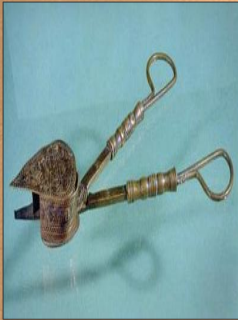
Ножницы для свечей. Италия. 16 в.