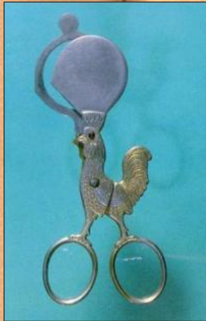
Ножницы для яиц. 1930г.