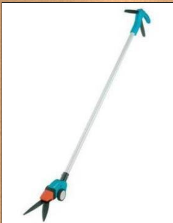
Ножницы для срезки травы