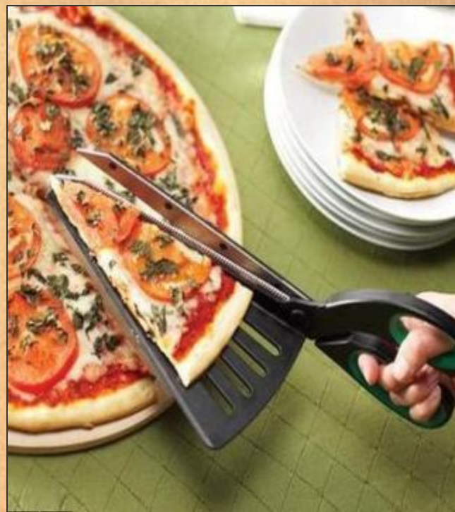
Ножницы для пиццы