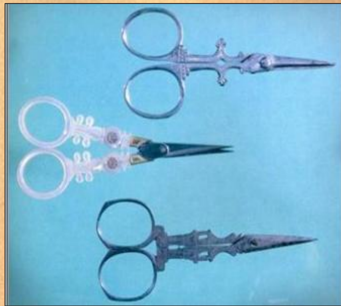
Ножницы для вышивания. Эпоха романтизма. Франция.