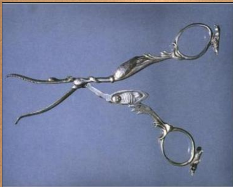
Ножницы в форме аиста, приносящего ребенка. Англия.