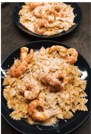
"Shrimp with a paste"