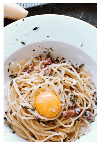
«Pasta alla carbonara» bon appetit