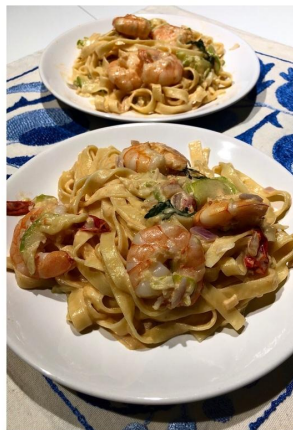
"King prawns with pasta and zucchini"