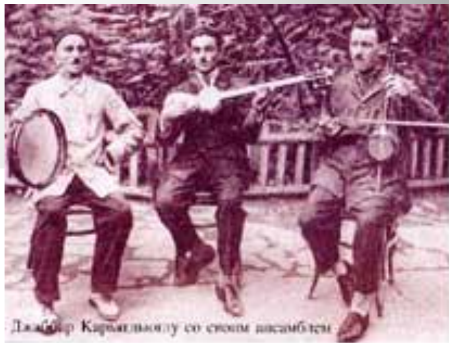
Джаббар Каримович со своим ансамблем