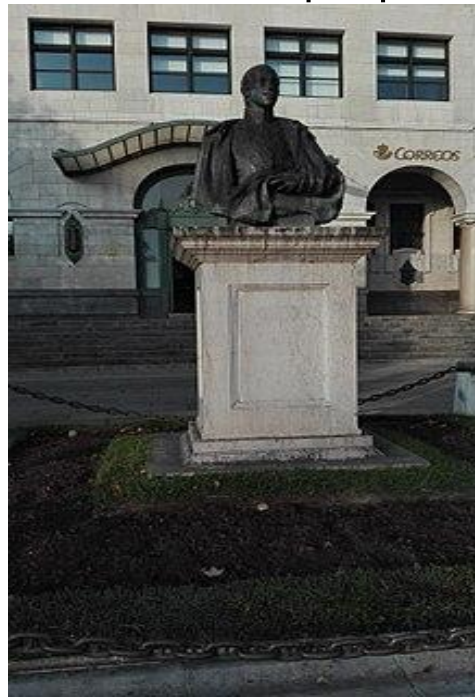
Monumento al Rey Alfonso XIII en Santander, Cantabria