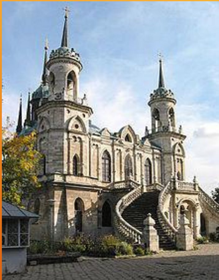
Владимирская церковь в Быково