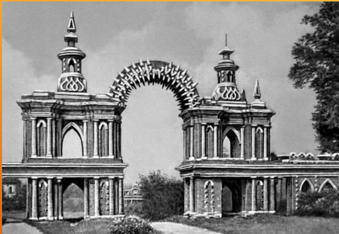
«Хлебные ворота» в Царицыно(или «е»?) Блин... а ведь скоро экзамен по русскому!!!) (Москва)