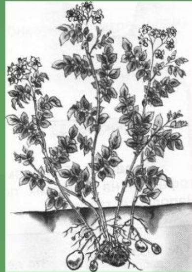
Картофель без окучивания