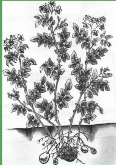
Картофель без окучивания