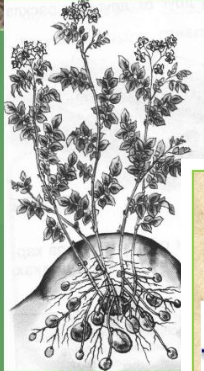
Картофель после окучивания

Окучивание – это подгребание к нижней части куста влажной почвы для образования дополнительных придаточных корней