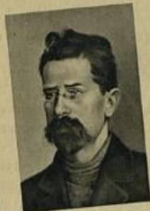
В. П. НОГИН