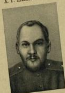
Н. В. КРЫЛЕНКО