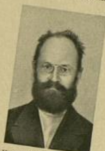
Н. И. СКВОРЦОВЪ (СТЕПАНОВЪ)