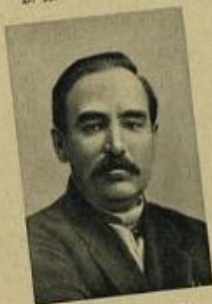
А. Г. ШЛЯПНИКОВ