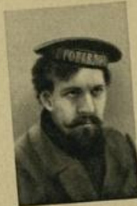
Ф. М. ДЫБЕНКО