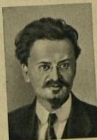
Л. Д. ТРОЦКИЙ