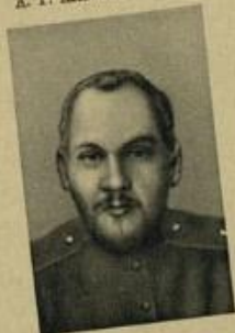
Н. В. КРЫЛЕНКО