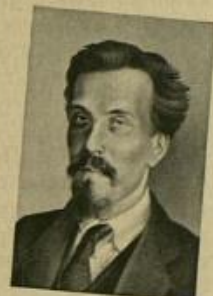
А. И. РЫКОВ