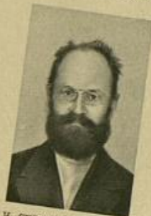
Н. И. СКВОРЦОВЪ (СТЕПАНОВЪ)