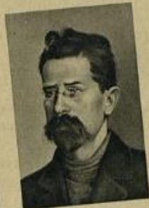
В. П. НОГИН