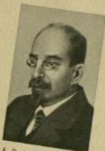
А. В. ЛУНАЧАРСКИЙ