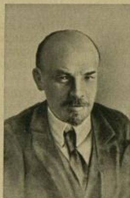
В. И. УЛЬЯНОВ-ЛЕНИН