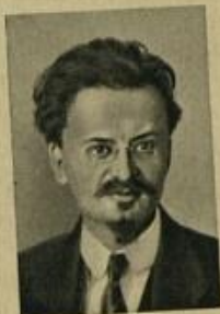
Л. Д. ТРОЦКИЙ