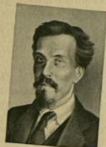
А. И. РЫКОВ