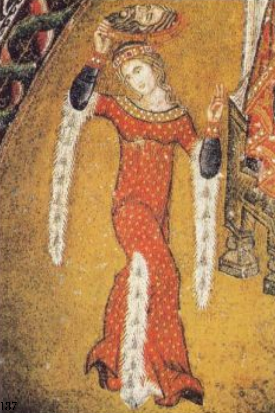
Танец Соломеи Фрагмент мозаики Венеция, собор св. Марка