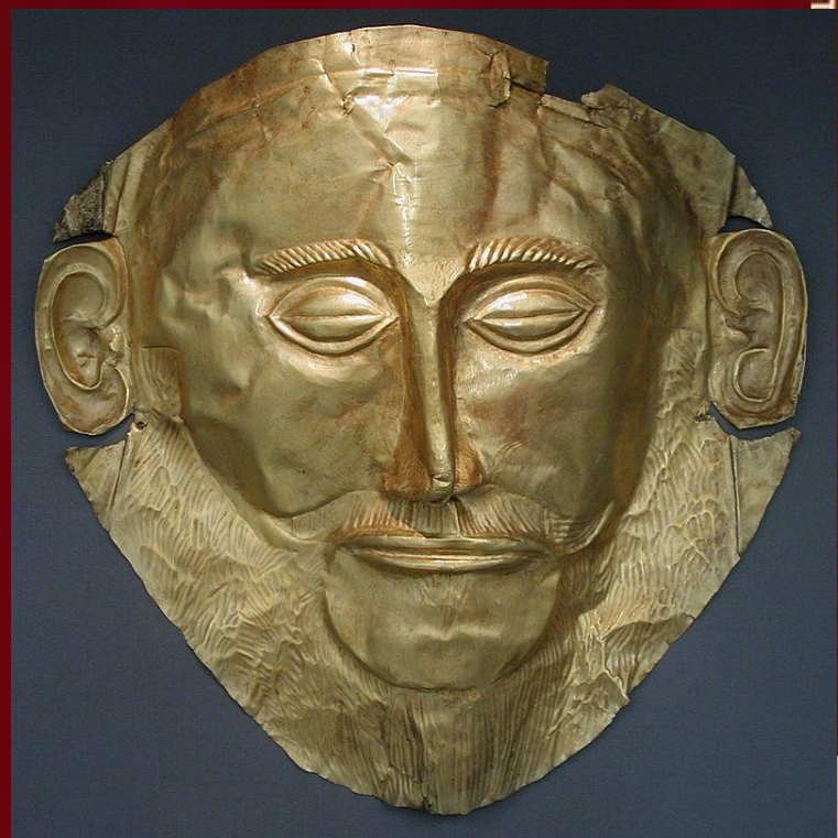
Маска ахейского царя Агамемнона