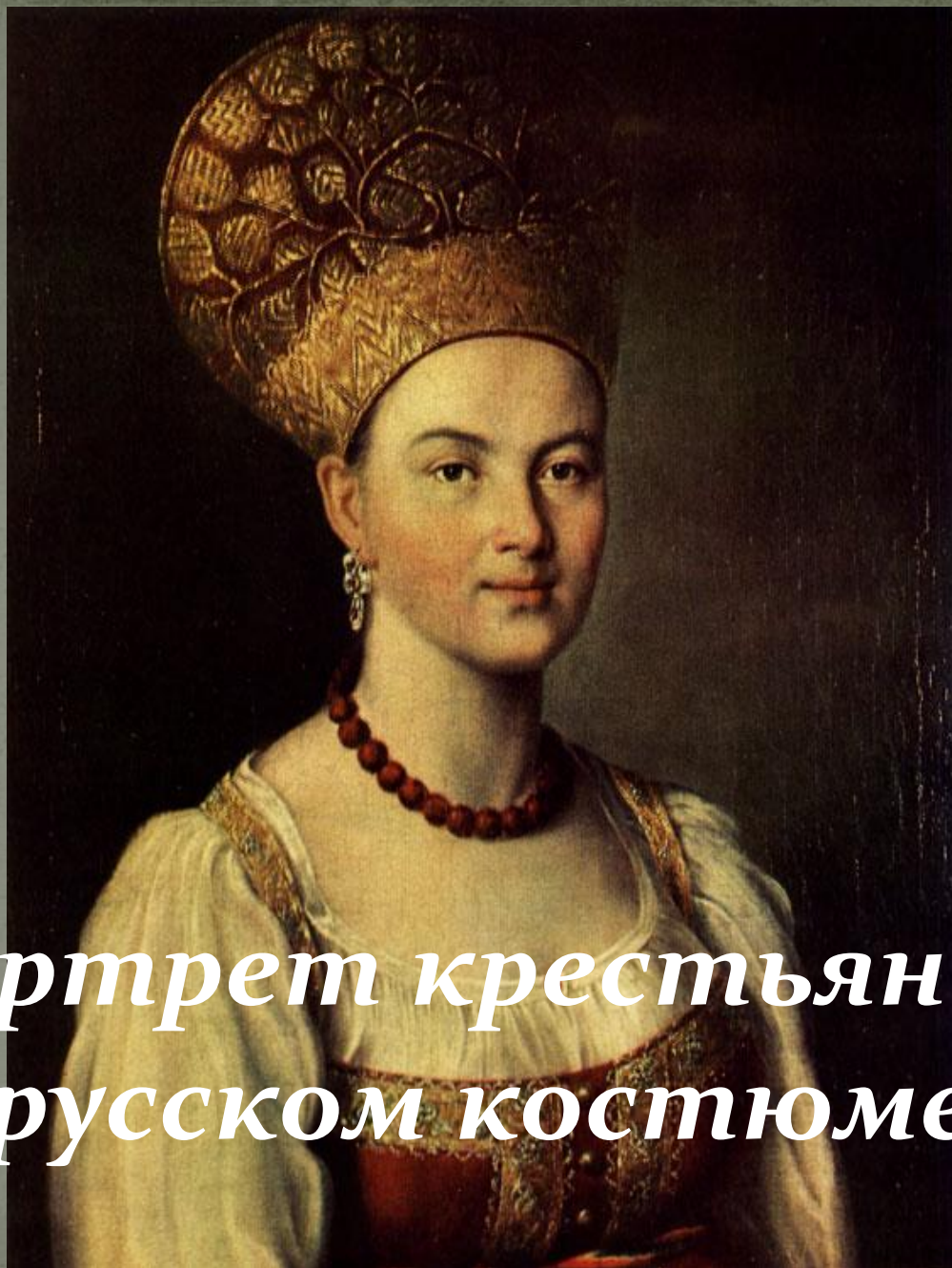
Портрет крестьянки в русском костюме.