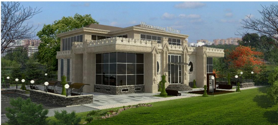
ЗАКАЗЧИК: ООО «Марсель и Компания»