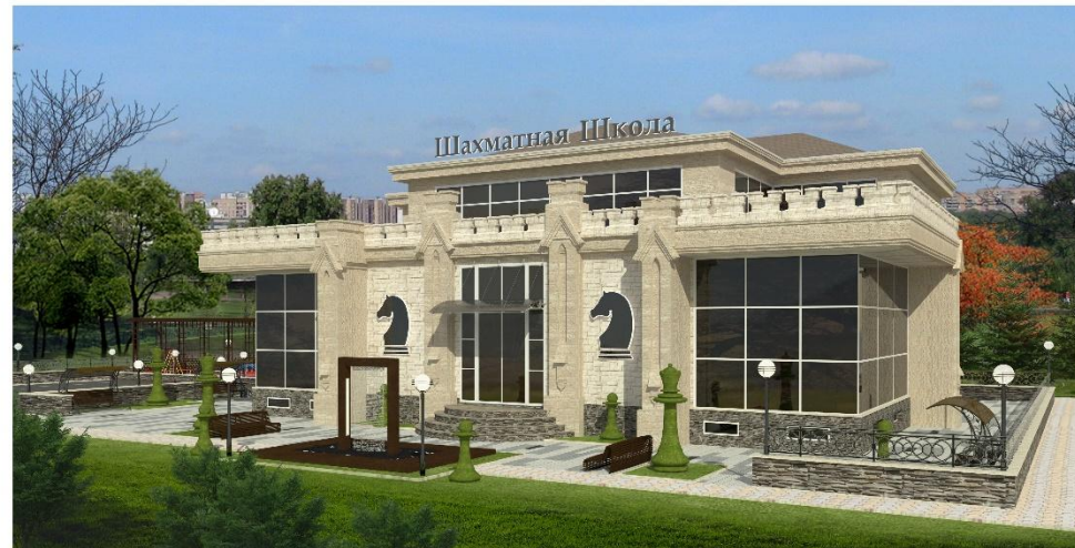
ЗАКАЗЧИК: ООО «Марсель и Компания»