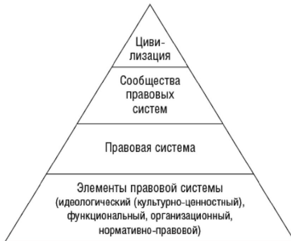
Рис. 1. Пирамида объектов сравнительного правоведения