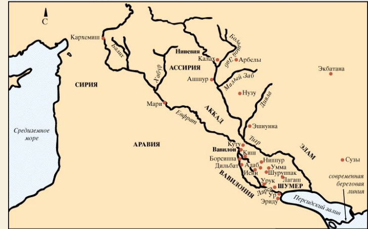
Важные — важнейшие города Мари — прочие города