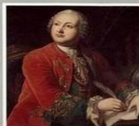
М.В.Ломоносов. Неизвестный художник XVIII в. Архангельский областной краеведческий музей

Ломоносов считал химию своей «главной профессией», причем развитие химии, по мнению ученого, должно было помочь решению практических задач. «Истинный химик должен быть теоретиком и практиком», — писал он. Став профессором химии, Ломоносов начал добиваться создания химической лаборатории.