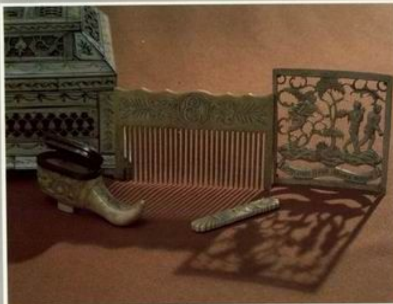
Резная кость. Тугой и грабли для коня. Музей М.В.Ломоносова. Ленинград