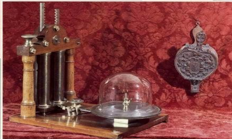
Вспомогательный аппарат XVIII в. Музей М.В.Ломоносова, Ленинград

Ломоносов считал химию своей «главной профессией», причем развитие химии, по мнению ученого, должно было помочь решению практических задач. «Истинный химик должен быть теоретиком и практиком», — писал он. Став профессором химии, Ломоносов начал добиваться создания химической лаборатории.