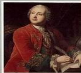
М.В.Ломоносов. Неизвестный художник XVIII в. Архангельский областной краеведческий музей

Ломоносов считал химию своей «главной профессией», причем развитие химии, по мнению ученого, должно было помочь решению практических задач. «Истинный химик должен быть теоретиком и практиком», — писал он. Став профессором химии, Ломоносов начал добиваться создания химической лаборатории.