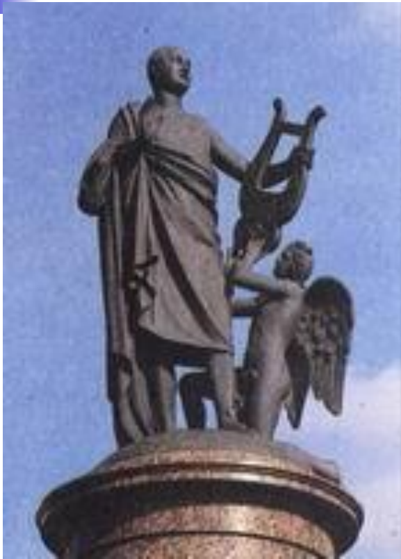
Памятник Ломоносову в г. Архангельске