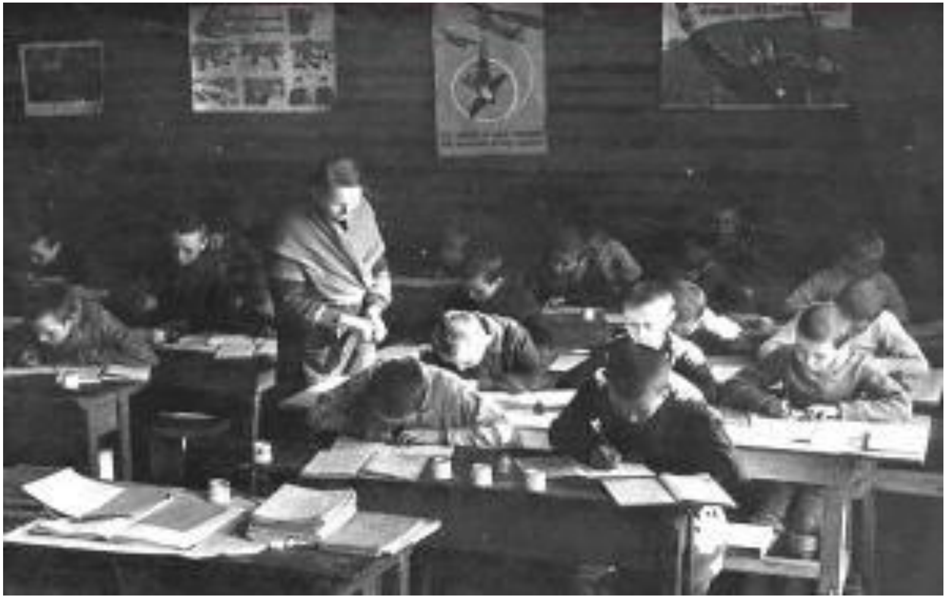
Военная школа. 1943 год.