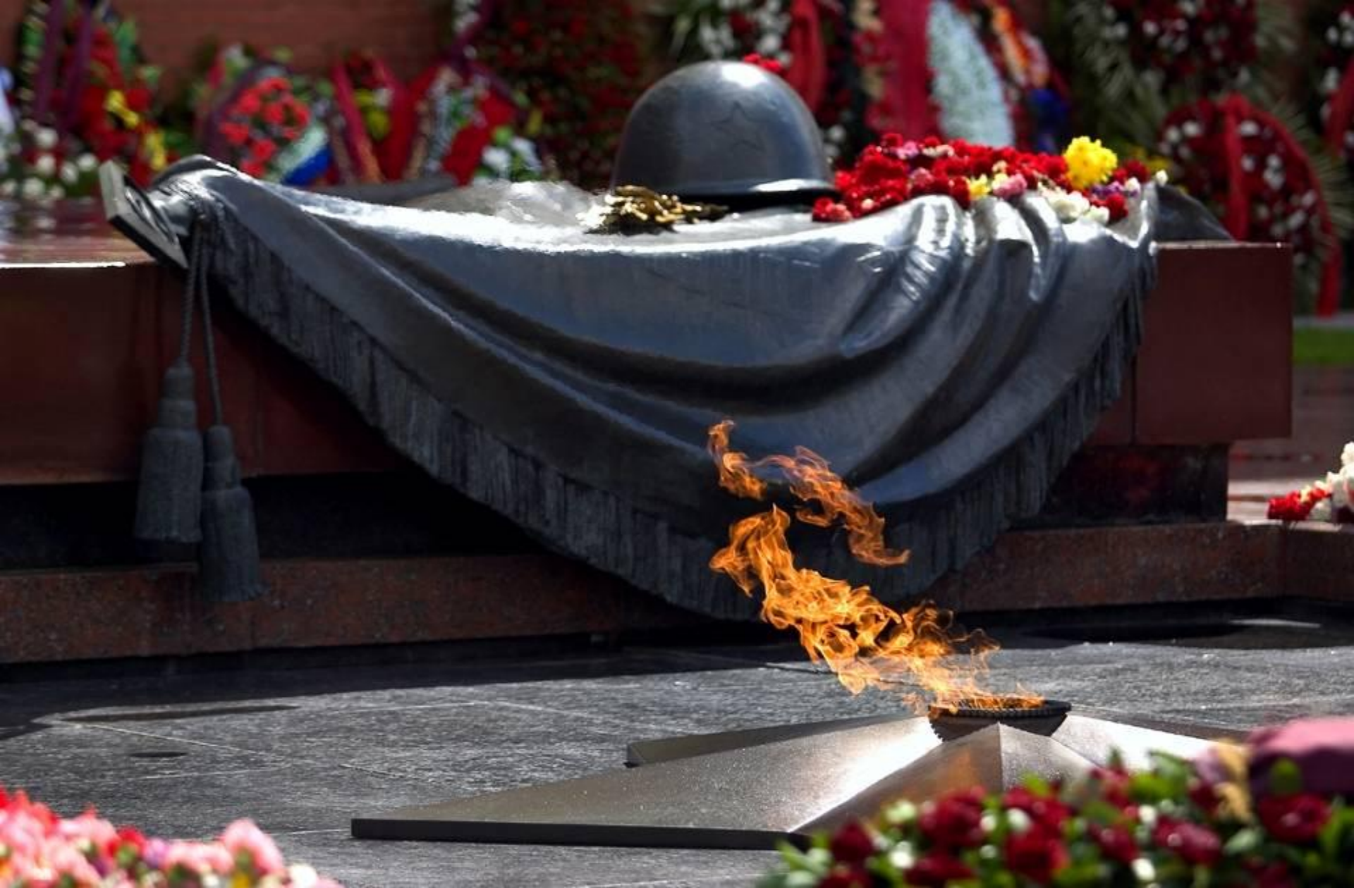
Могила неизвестного солдата у стены Кремля. Александровский сад.