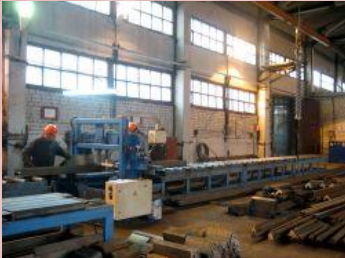
Завод Металлоконст- рукций