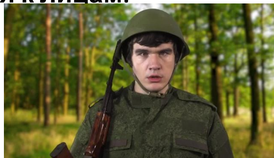
имевшим плохую успеваемость в школе или низкий общеобразовательный уровень