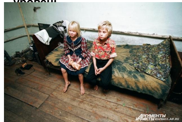
из неполных или неблагополучных семей