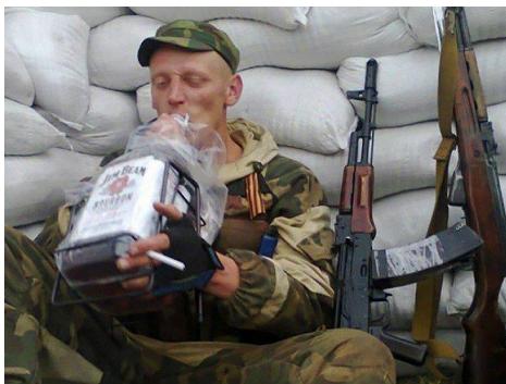
склонным к употреблению наркотиков, наркосодержащих средств и алкоголя