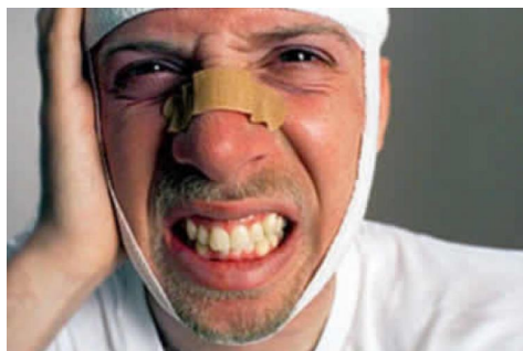
получившим травмы головного мозга

При первом знакомстве с прибывшим личным составом необходимо тщательно собрать сведения, касающиеся характеристики психологического состояния военнослужащих, особое внимание должно проявляться к лицам: