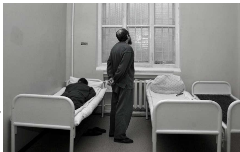
находившимся на учете в психоневрологическом диспансере