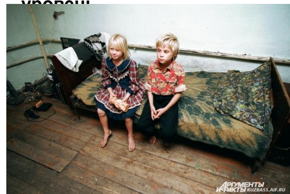
из неполных или неблагополучных семей