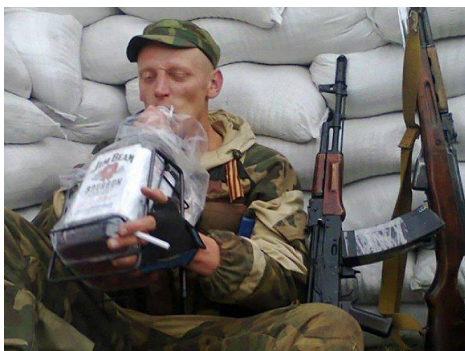
склонным к употреблению наркотиков, наркосодержащих средств и алкоголя