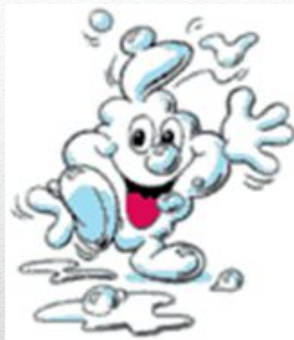
Товарный знак фирмы Ханс Шварцкопф энд Хенкель КГА энд Ко КГ (Германия).