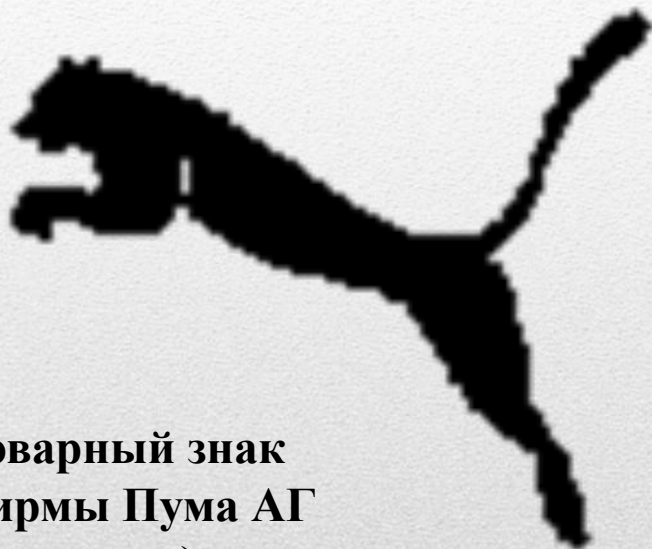
Товарный знак фирмы Пума АГ (Германия).