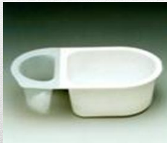
Товарный знак фирмы Компани Жерве Данон (Франция).