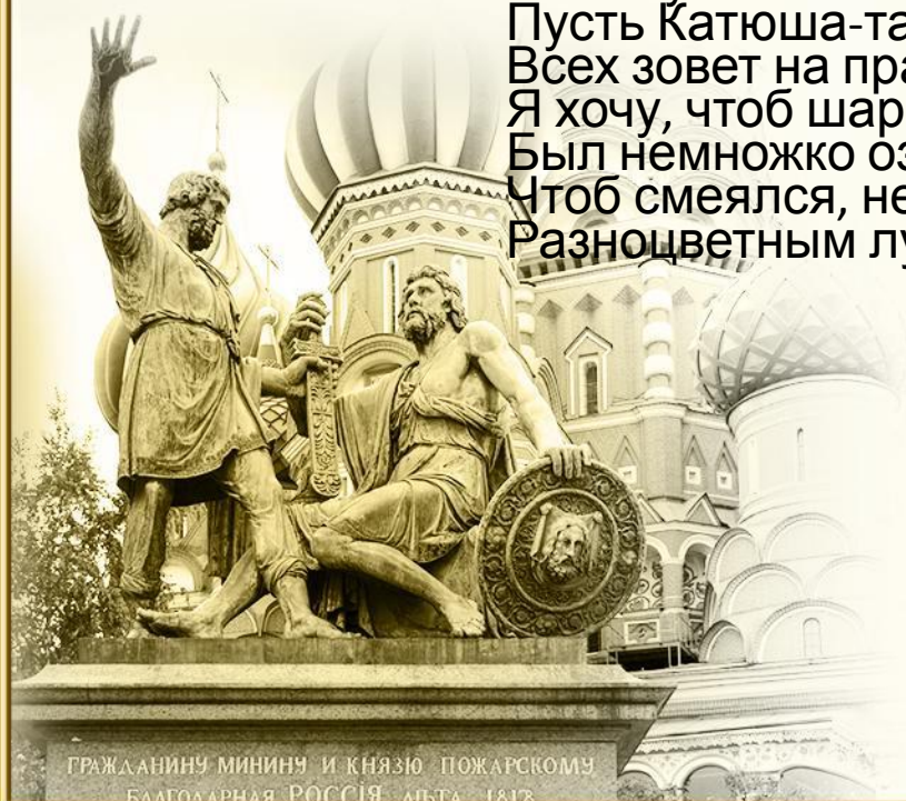
ГРАЖДАНИНУ МИНИНУ И КНЯЗЮ ПОЖАРСКОМУ БЛАГОДАРНАЯ РОССИЯ. АПР. 1812.

Лети, бело, синий красный лепесток, И на Запад, на Восток И на Север, теплый Юг, Расскажи, кто лучший друг. Вот зеленый лепесток — Из России платок. Я Катюшу наряжу, Всем ребятам покажу. А вот синий чистый свет, Всем знакомый с малых лет А вот желтый солнца луч, Он приветлив и могуч. Наконец, вот черный цвет - Не хочу войны я. Нет! Пусть Катюша-талисман Всех зовет на праздник к нам Я хочу, чтоб шар земной Был немножко озорной, Чтоб смеялся, не тужил, Разноцветным лугом был!