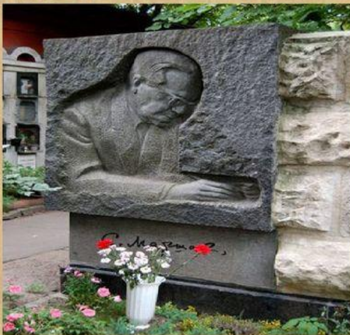
С. Я. Маршак (1887 – 1964) 130 лет со дня рождения