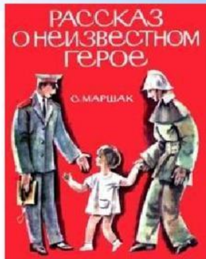
Рассказ О неизвестном герое