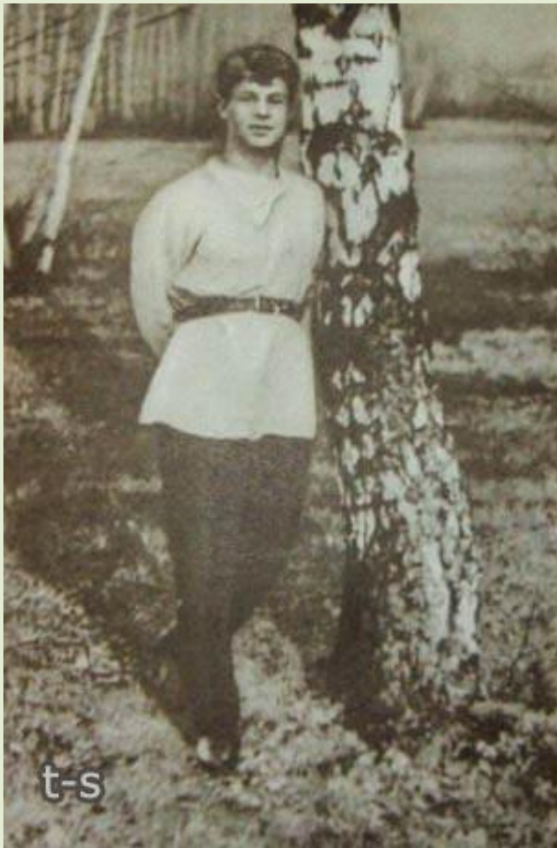
Сергей Есенин у березы. Фото - 1918 год.

В начале 1918 Есенин переезжает в Москву. С воодушевлением встретив революцию, он пишет несколько небольших поэм ("Иорданская голубица", "Инония", "Небесный барабанщик", все 1918, и др.), проникнутых радостным предчувствием "преображения" жизни. Богоборческие настроения сочетаются в них с библейской образностью для обозначения масштаба и значимости происходящих событий. Есенин воспевая новую действительность и ее героев пытался соответствовать времени ("Кантата", 1919). В более поздние годы им были написаны "Песнь о великом походе", 1924, "Капитан земли", 1925, и др.). Размышляя, "куда несет нас рок событий", поэт обращается к истории (драматическая поэма "Пугачев", 1921).