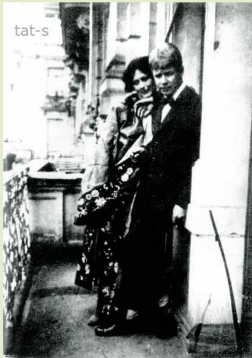
Сергей Есенин и Айседора Дункан, на улицах Венеции. Фото - август 1922 год.