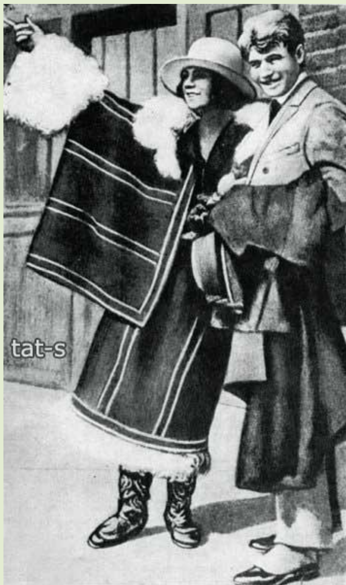
Сергей Есенин и Айседора Дункан на пароходе "Paris". Фото (3) - 1 октября 1922 год