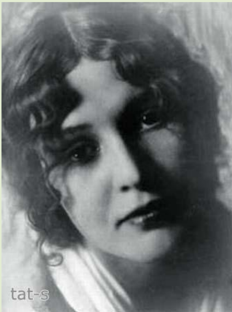
Жена Есенина, актриса - Зинаида Николаевна Райх (1894 - 1939)

30 июля 1917 года Есенин (21 год) обвенчался актрисой Зинаидой Райх в церкви Кирика и Улиты Вологодского уезда.