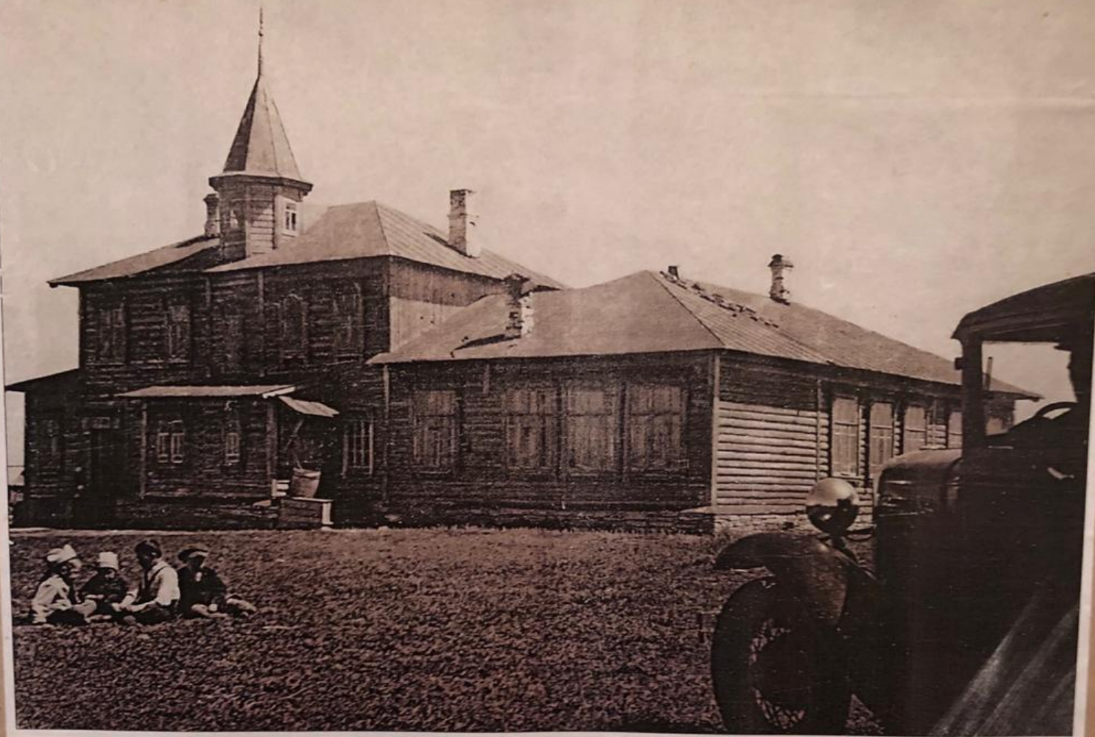
Үтеш ауылында Мәжит Ғафури укыған мәктәп