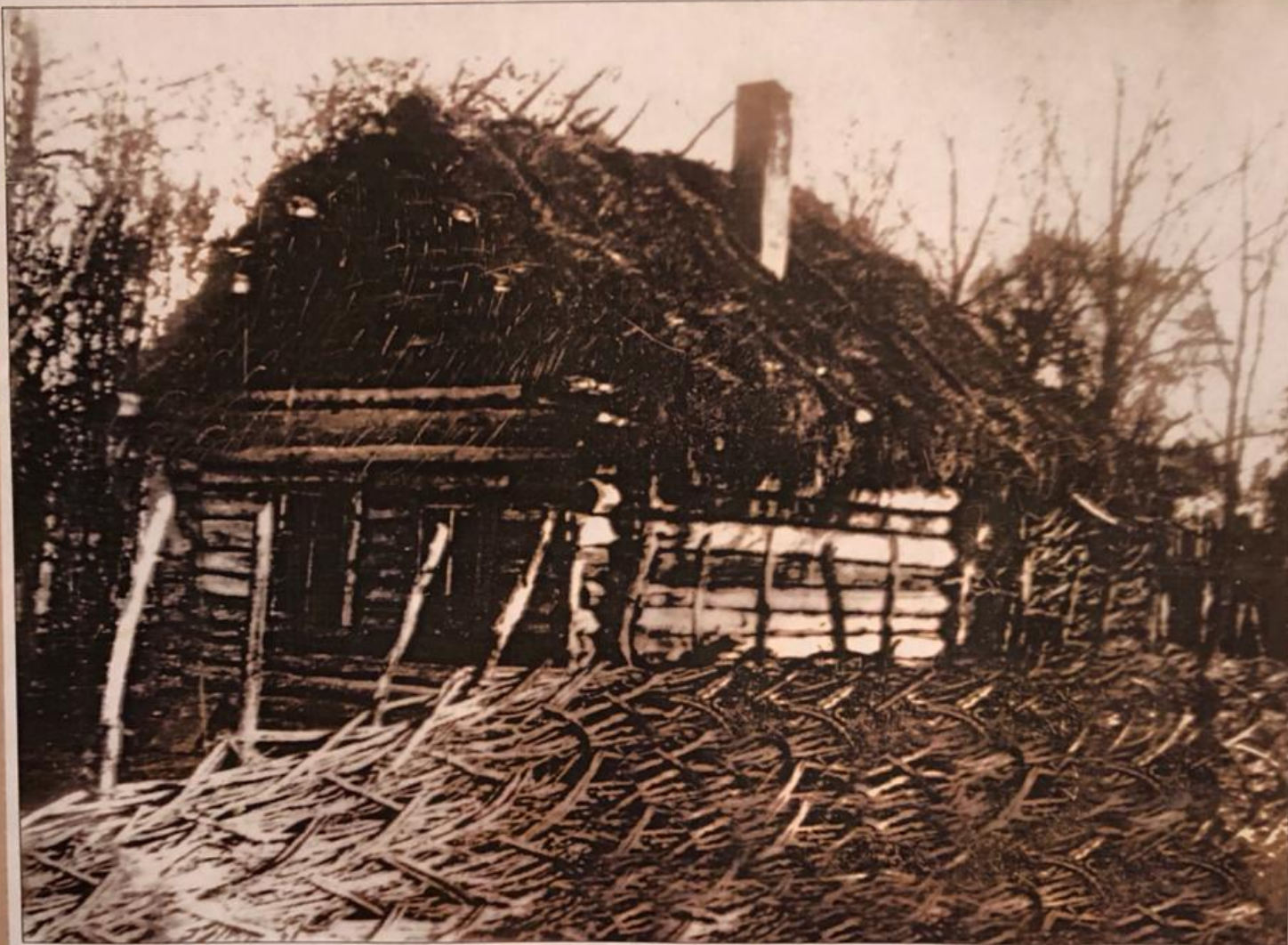
Мәжит Гафури тыуған йорт. Езем-Каран ауылы

Дом, в котором родился Мажит Гафури. Деревня Зилим-Караново