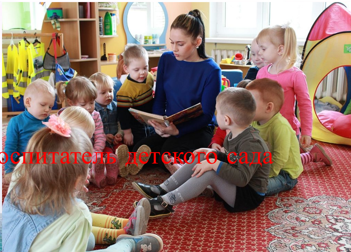
Воспитатель детского сада