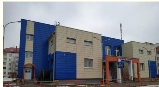
Объект: «Блок плавательных бассейнов в г.Ветка»