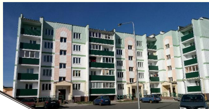
Объект: “60 кв.ж.д. г.Житковичи”