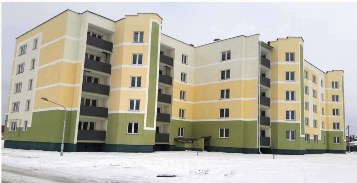
Объект: “60 кв. ж.д. в г.Ветка”