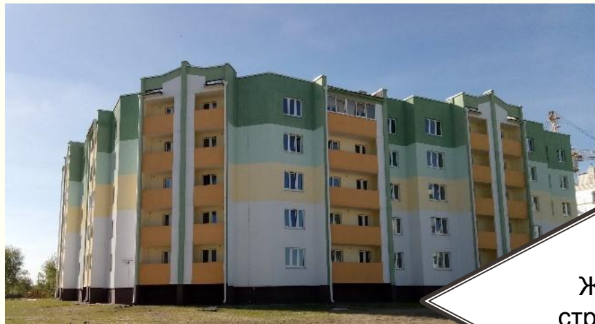
Объект: “60 кв.ж.д. г.Калинковичи”