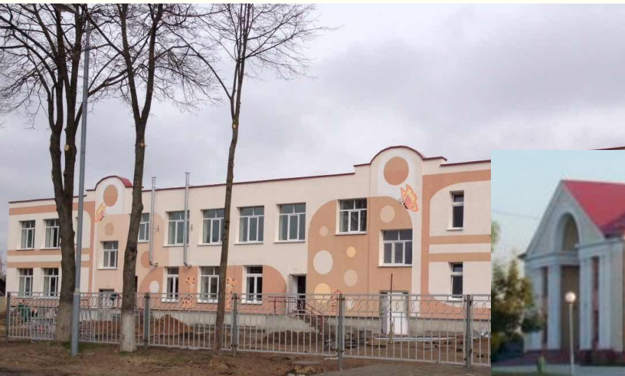
Объект: “Средняя школа Петриковский район”

Введены в эксплуатацию объекты социально- культурного и бытового назначения