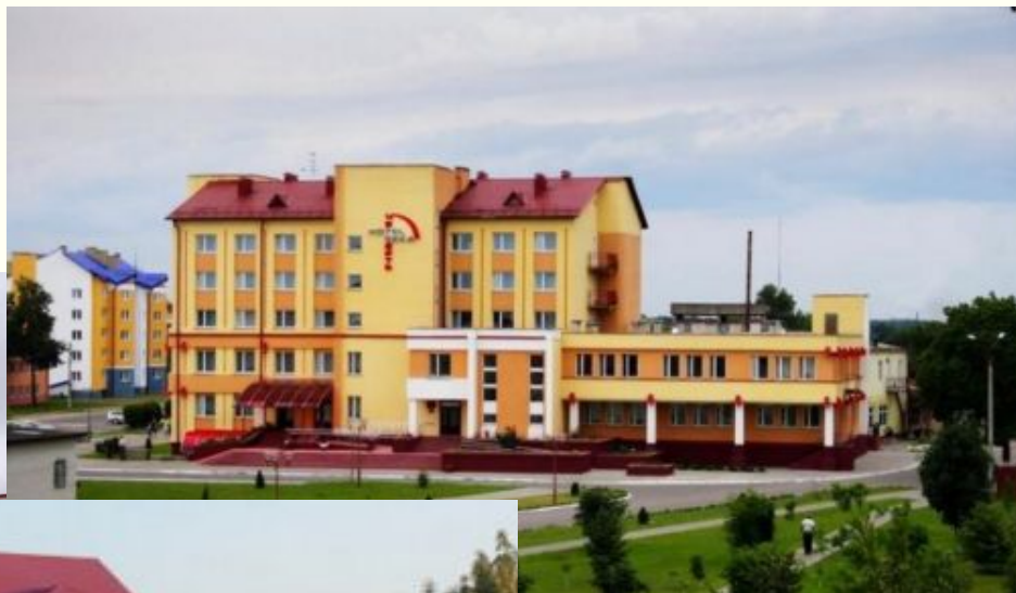
Объект: “Гостиница в г.Житковичи”