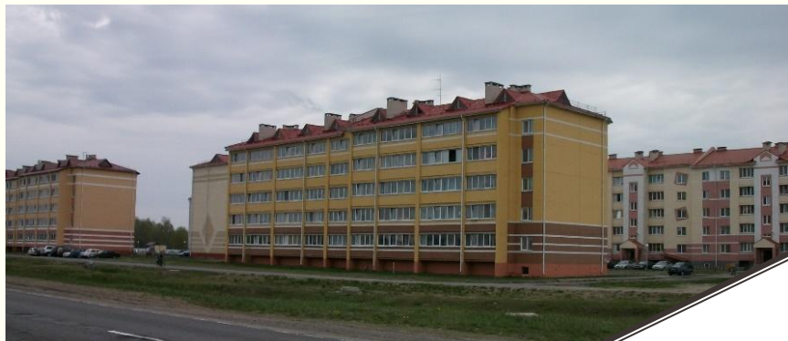
Группа жилых домов г.Петриков