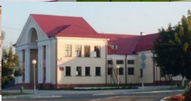
Объект: “Дом культуры г.Петриков”