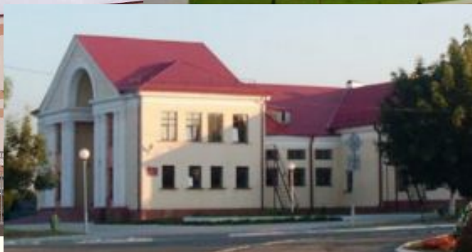
Объект: “Дом культуры г.Петриков”