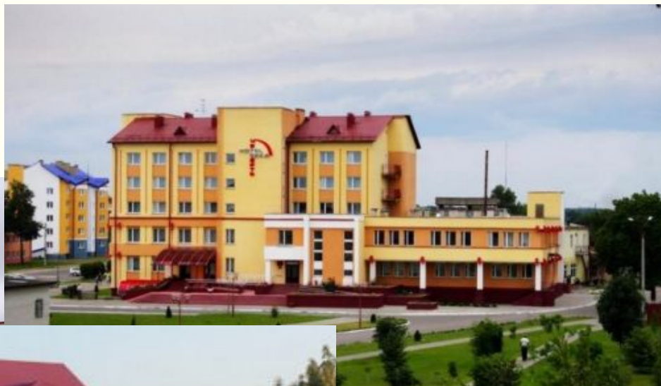
Объект: “Гостиница в г.Житковичи”