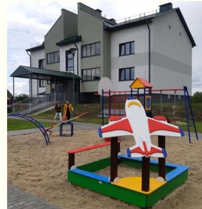
Объект: «Строительство общежития для военнослужащих пограничной заставы в н.п. Киров Норвежского района»