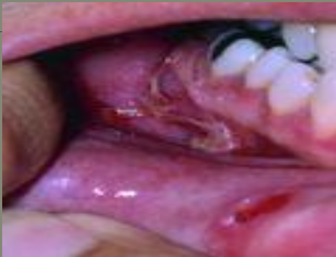
Пузырчатка бразильская, или «дикий огонь»