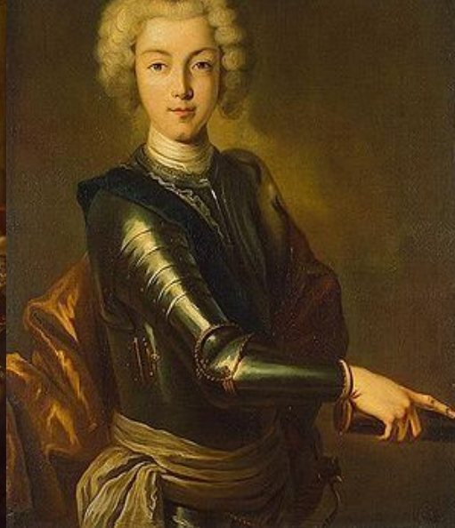
Анна Иоанновна (1730-1740)