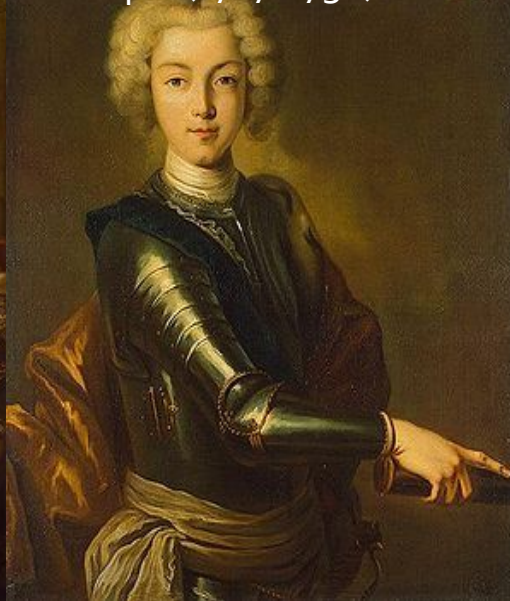
Анна Иоанновна (1730-1740)