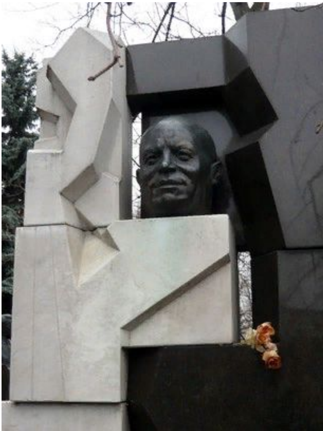
Надгробие на могиле Хрущева (автор: Э. Неизвестный)