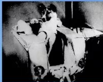
3 ноября 1957 г. «Спутник 2» с собакой Лайкой