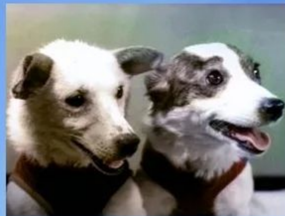
19 августа 1960 г. «Спутник 5» с собаками Белкой и Стрелкой