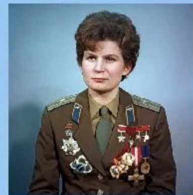
16 июня 1963 г. «Восток 6» с В.В.Терешковой