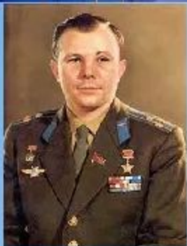
12 апреля 1961 г. «Восток 1» с Ю.А.Гагариным