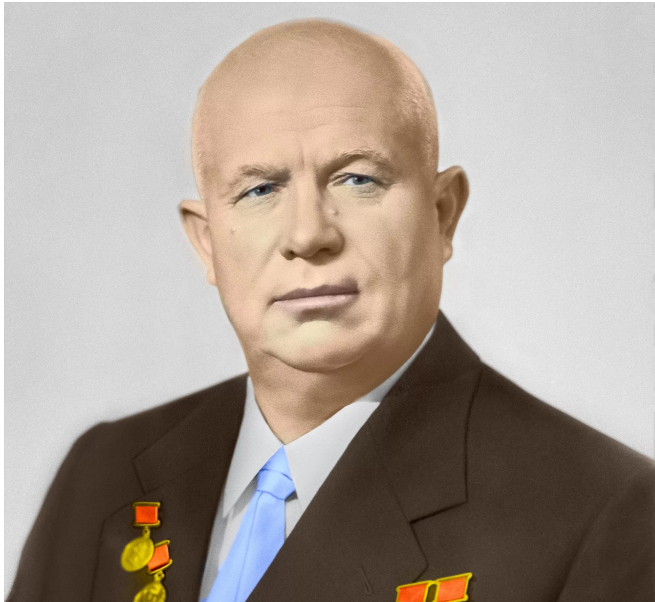
Никита Сергеевич Хрущев (1953-1964) 1 секретарь ЦК КПСС, Председатель Совмина