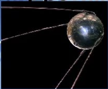
4 октября 1957 г. «Спутник 1»