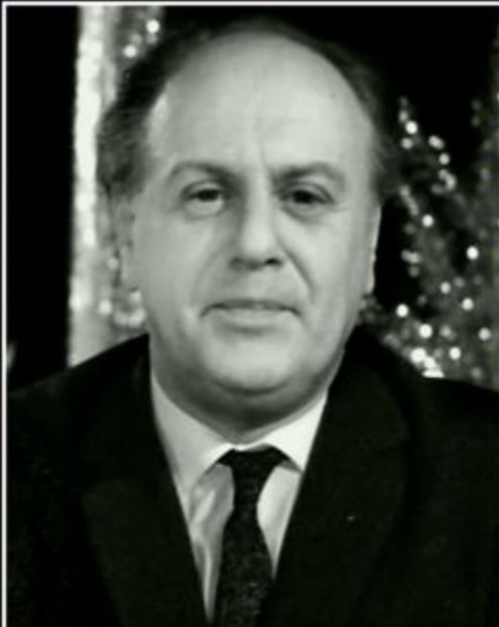
ДОЛМАТОВСКИЙ Евгений Аронович (05.05.1915 г. — 10.09.1994 г.)

Умер в Москве 10 сентября 1994 года. Похоронен на Донском кладбище г.