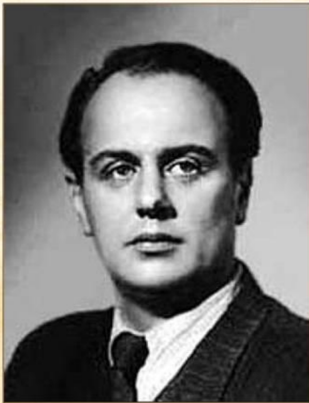
Евгений Аронович Долматовский

Е.А.Долматовский: «Катюша» - это паспорт тридцатых годов. Песня «стала тем незримым проводом, который шёл от сердец советских людей в городах и сёлах нашей огромной страны к далёким пограничным заставам».