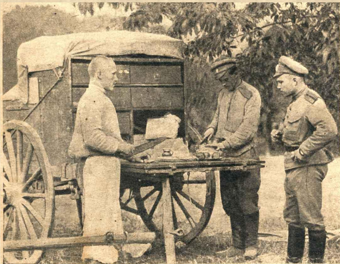
Въ походѣ. „Офицерскѣ собраніе“.