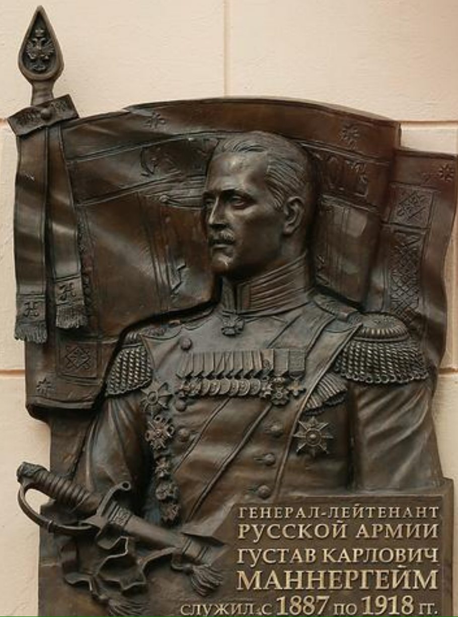
ГЕНЕРАЛ-ЛЕЙТЕНАНТ РУССКОЙ АРМИИ ГУСТАВ КАРЛОВИЧ МАННЕРГЕЙМ служил с 1887 по 1918 гг.