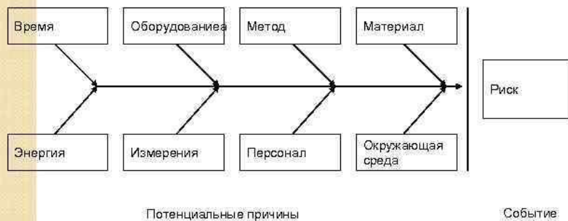
Диаграмма «Ишикава» (причина и эффект)