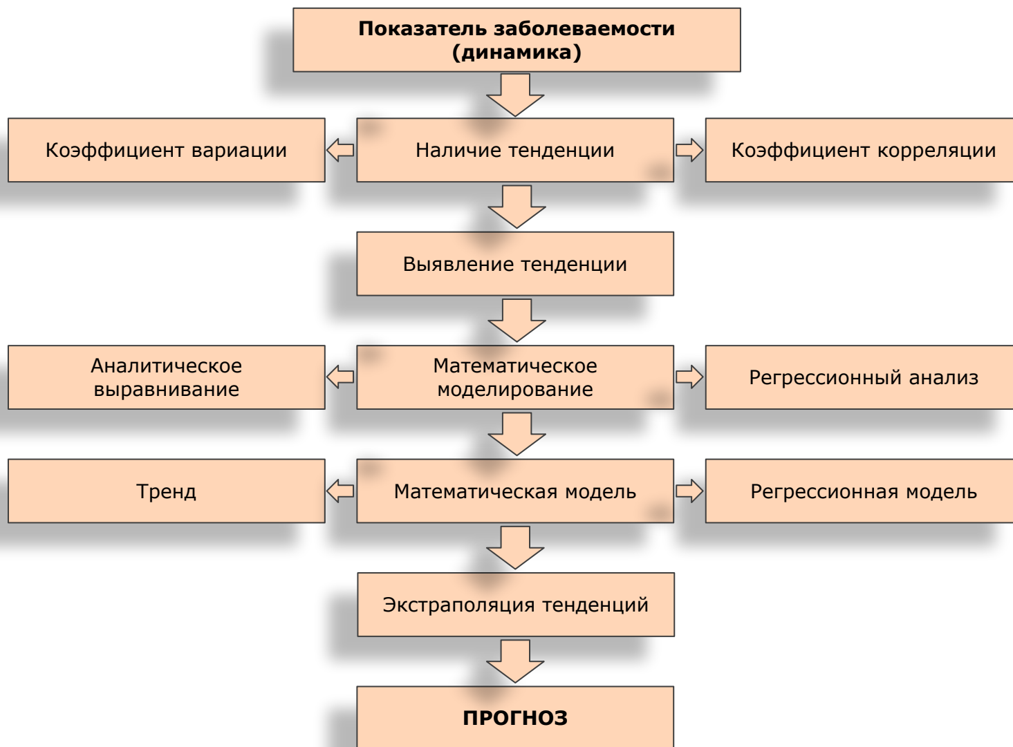
Рис. Алгоритм математического моделирования и прогнозирования состояния заболеваемости на региональном уровне