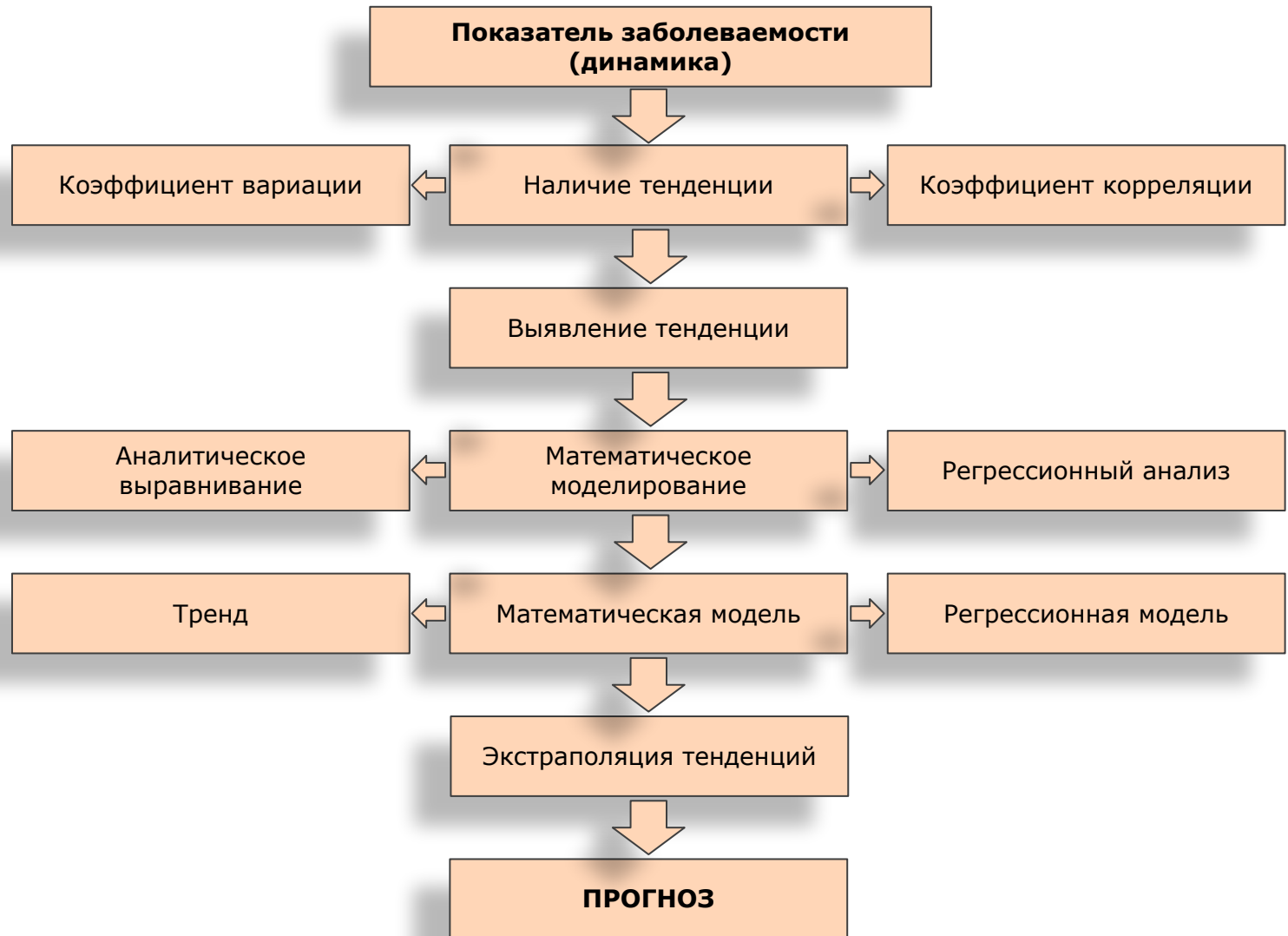
Рис. Алгоритм математического моделирования и прогнозирования состояния заболеваемости на региональном уровне