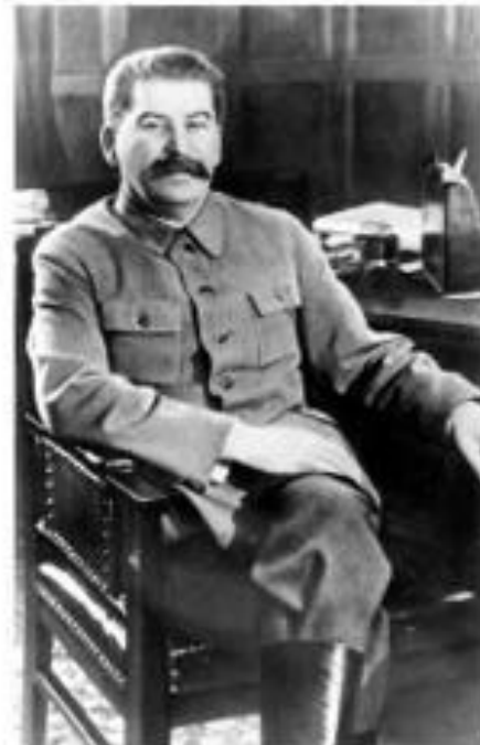
И. В. Сталин