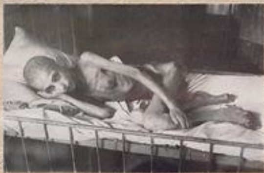
ДИСТРОФИЯ ЭЛЕМЕНТАРНАЯ (ГОЛОДНАЯ БОЛЕЗНЬ) – НАРУШЕНИЕ ОБЩЕГО ПИТАНИЯ ОРГАНИЗМА ВСЛЕДСТВИЕ ДЛИТЕЛЬНОГО НЕДОЕДАНИЯ, КОГДА ПИЩА СОДЕРЖИТ НЕДОСТАТОЧНОЕ КОЛИЧЕСТВО КАЛОРИЙ, СРАВНИТЕЛЬНО С ЗАТРАЧИВАЕМОЙ ЭНЕРГИЕЙ. ПОСЛЕ ВОЙНЫ У ДИСТРОФИИ ВОЯВИЛОСЬ ЕЩЕ ОДНО – НЕОФИЦИАЛЬНОЕ НАЗВАНИЕ – «ЛЕНИНГРАДСКАЯ БОЛЕЗНЬ»

За годы блокады погибло, по разным данным, от 400 тыс. до 1 млн человек. Так, на Нюрнбергском процессе фигурировало число 632 тысячи человек. Только 3 % из них погибли от бомбёжек и артобстрелов; остальные 97 % умерли от голода.