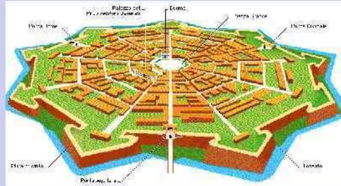
Пальманова — итальянская коммуна в провинции Удине.

Проект идеального города Сфорцинда Антонио Филарете, 1400-1469, итальянский архитектор