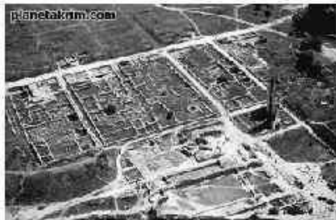
Регулярная, или прямоугольная