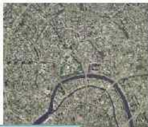
Нерегулярная, или свободная