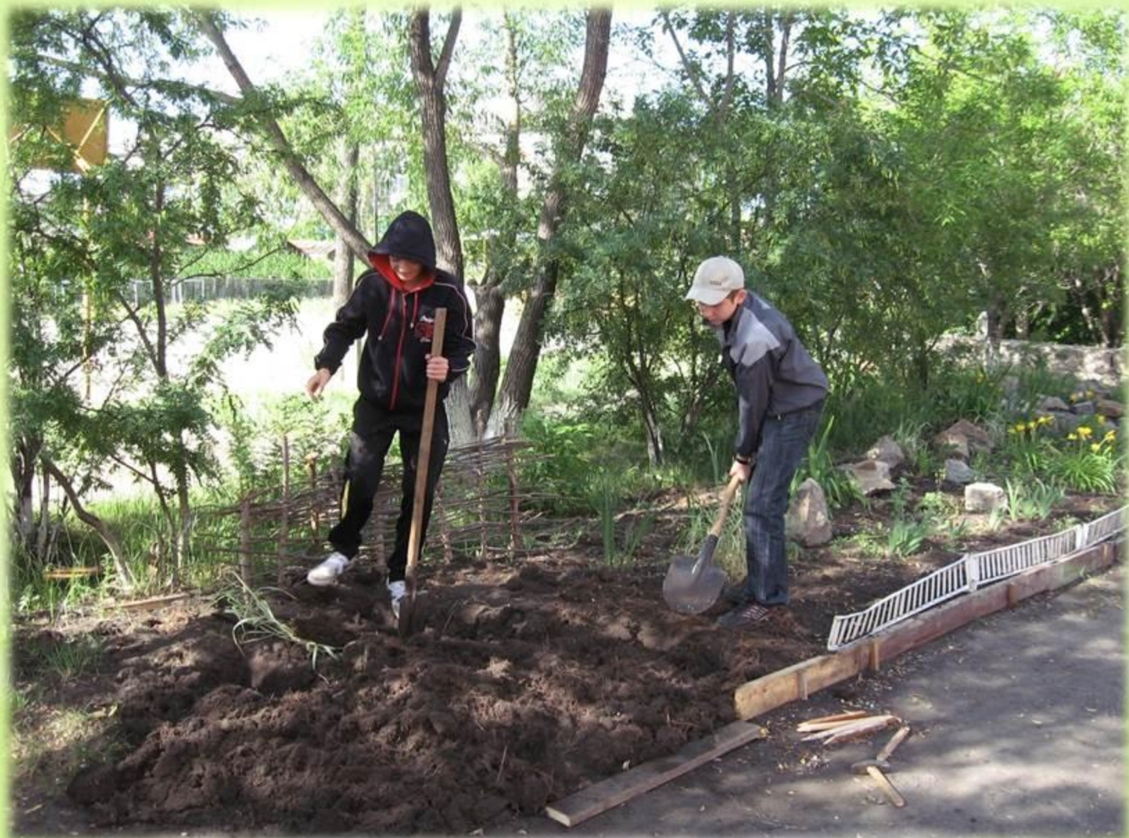
2013г. Место для клумбы «В гостях у сказки»»