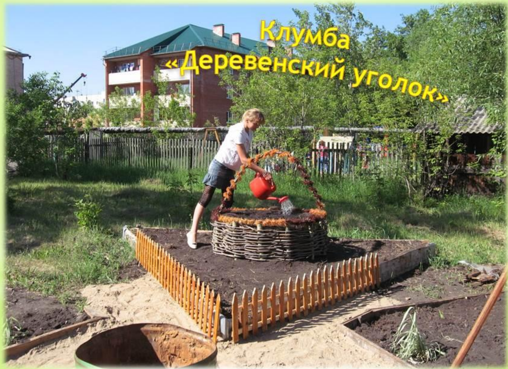
2014г. Закладка клумбы