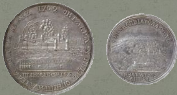
Серебряная медаль в честь взятия Нотебурга

Штурм был необычайно трудным и кровопролитным. «Правда, что зело жесток сей орех был, однако, слава богу, счастливо разгрызен. Артиллерия наша зело чудесно дело своё исправила», — писал Петр А. А. Виниусу. Старый русский город, раньше называвшийся Орешком, вернулся в русские руки и был переименован в Шлиссельбург («ключ-город», открывавший дорогу к овладению устьем Невы).