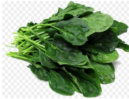
Шпинат – зеленый цвет