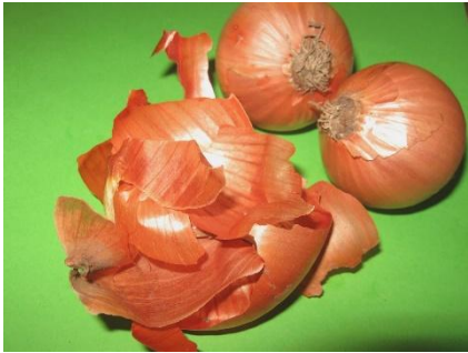
Шелуха лука – коричневый цвет