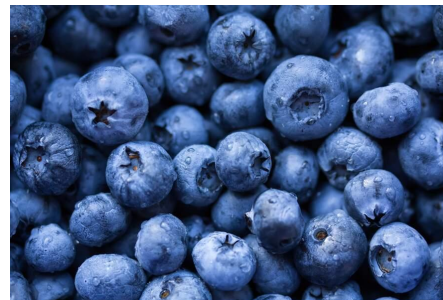
Ягоды черники- синий цвет