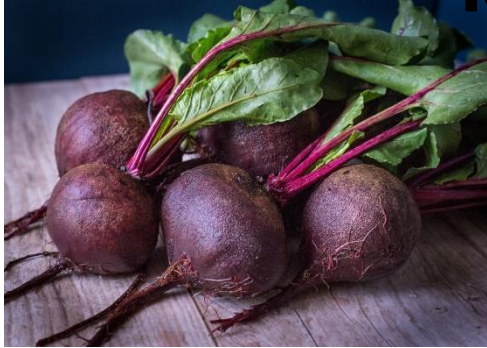
Свекла – красный цвет