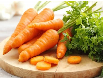
Морковь – оранжевый цвет