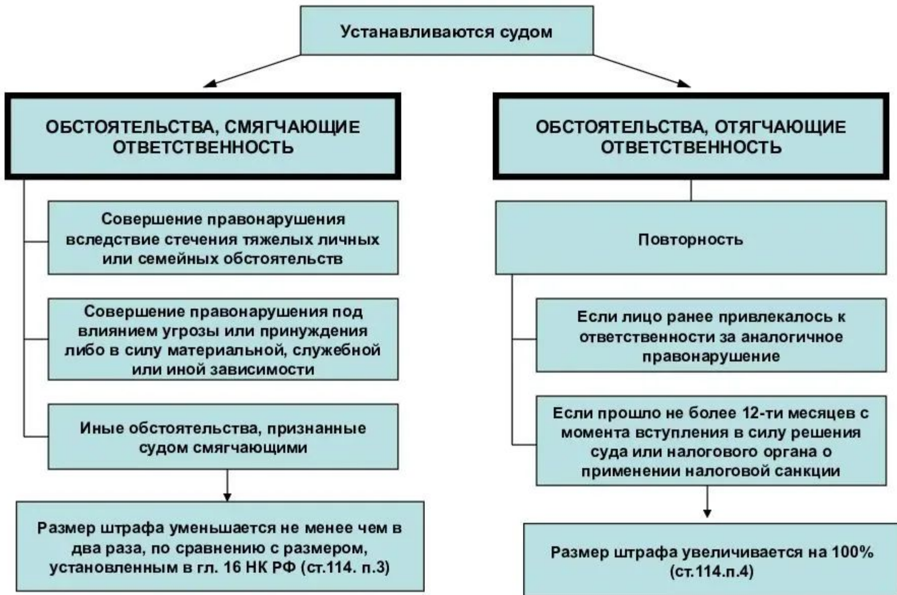
Схема 14. Обстоятельства, смягчающие и отягчающие ответственность за совершение правонарушения (ст. 112 НК РФ)