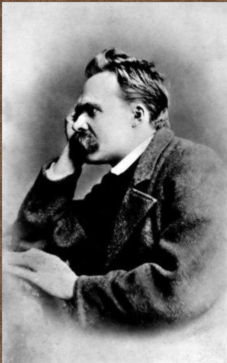
Ф.В. Ницше (1844-1900)