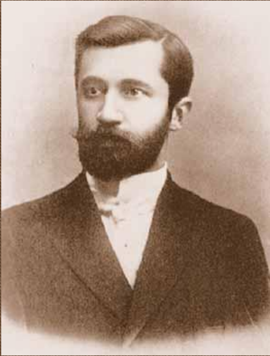
Д.С. Мережковский (1865-1941)