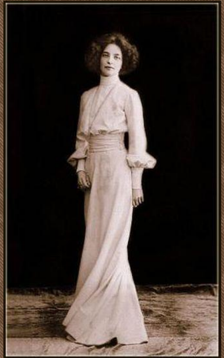
З.Н. Гиппиус (1869-1945)