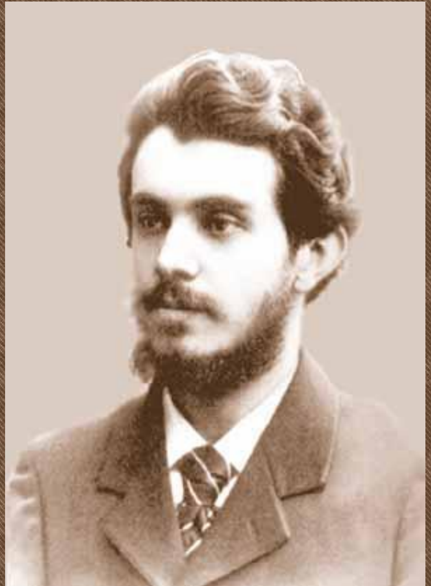
Н.А. Бердяев (1874-1948)