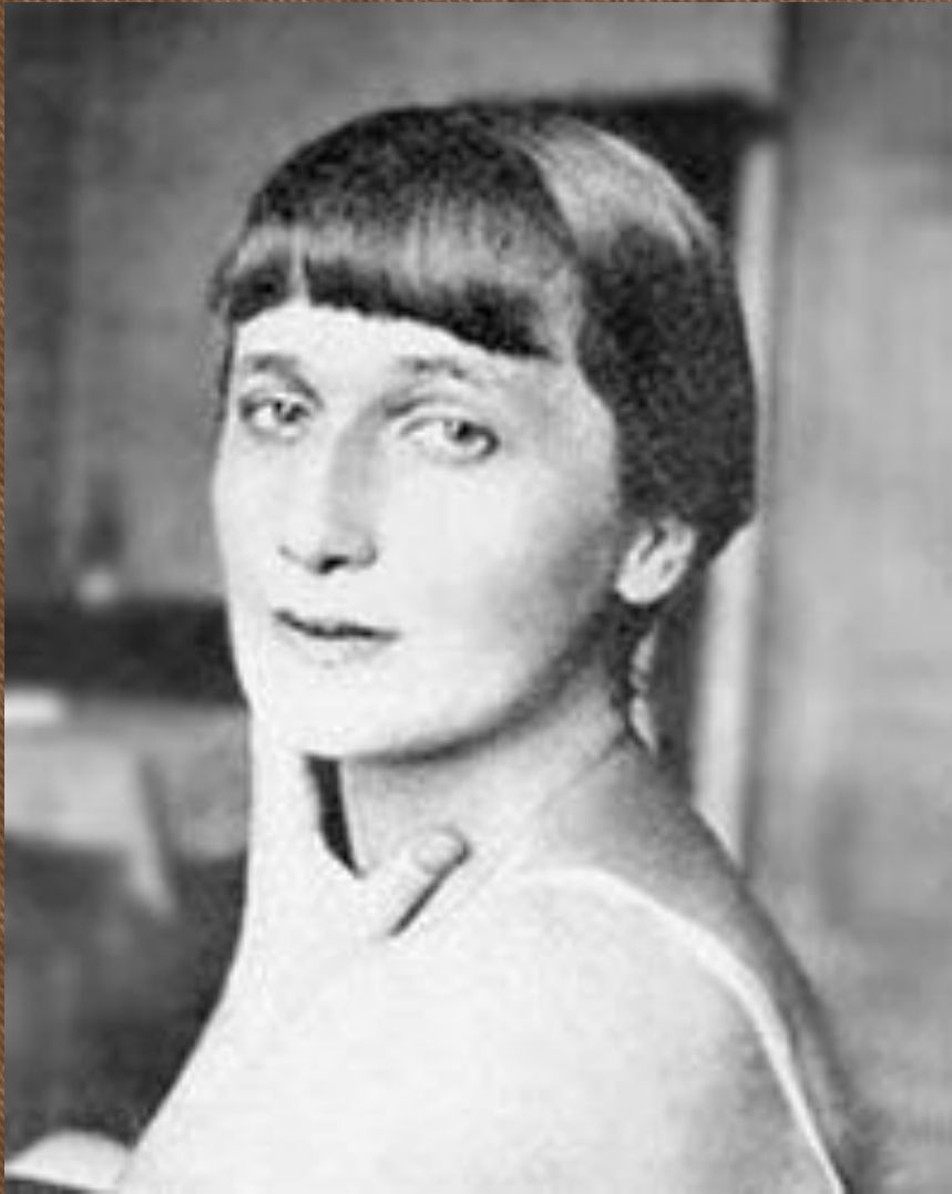
А.А. Ахматова (1889-1966)