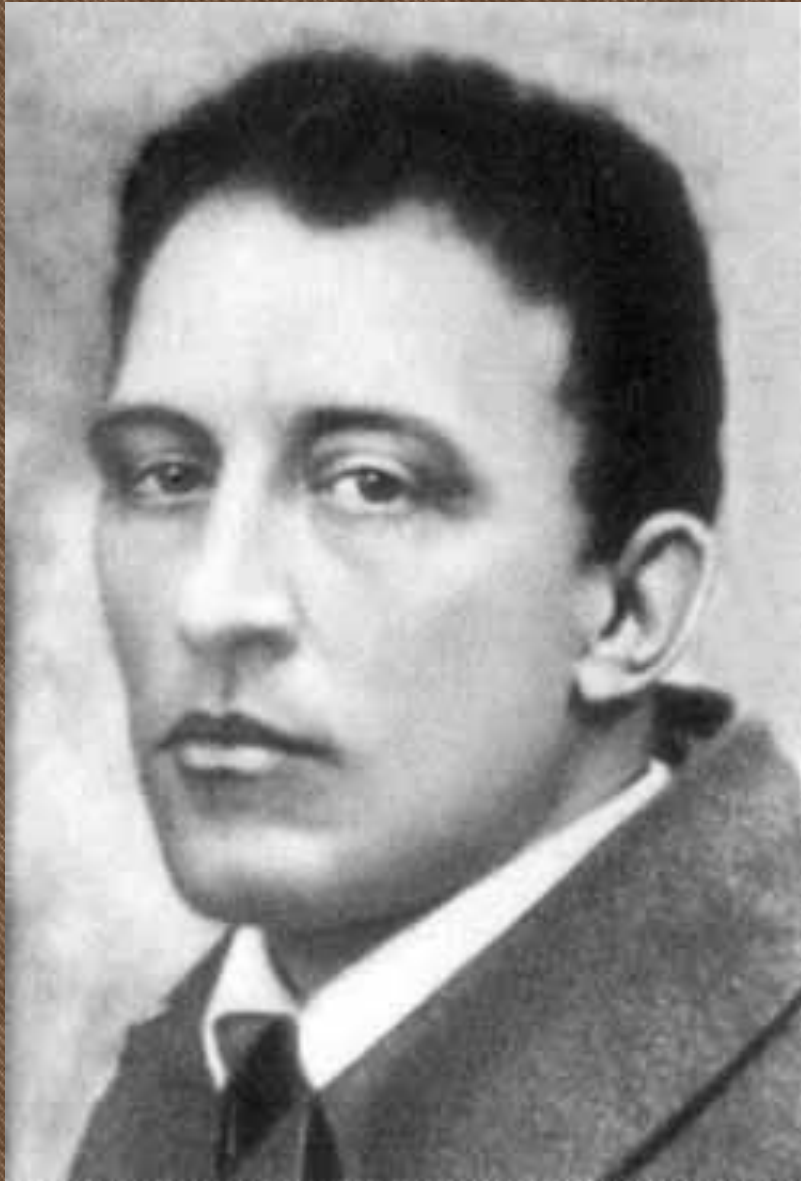
А.А. Блок (1880-1921)