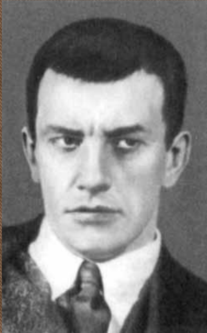
В.В. Маяковский (1893-1930)