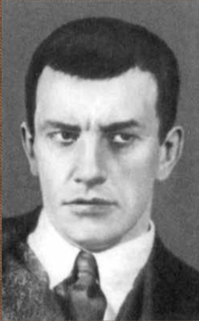
В.В. Маяковский (1893-1930)