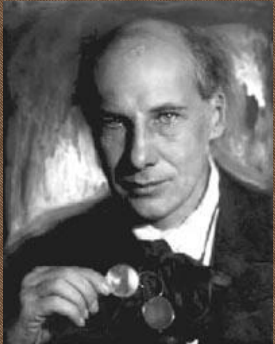
А. Белый (1880-1934)