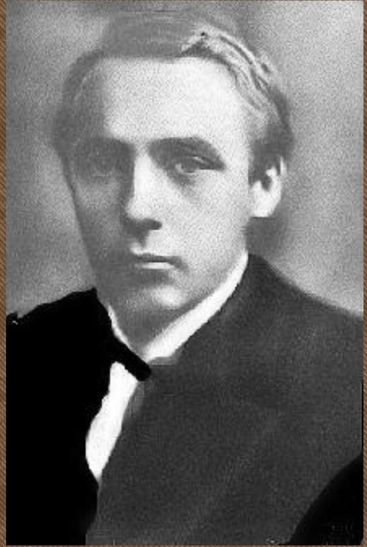
В.В. Хлебников (1885-1922)