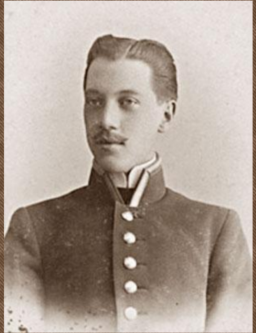
Н.С. Гумилев (1886-1921)