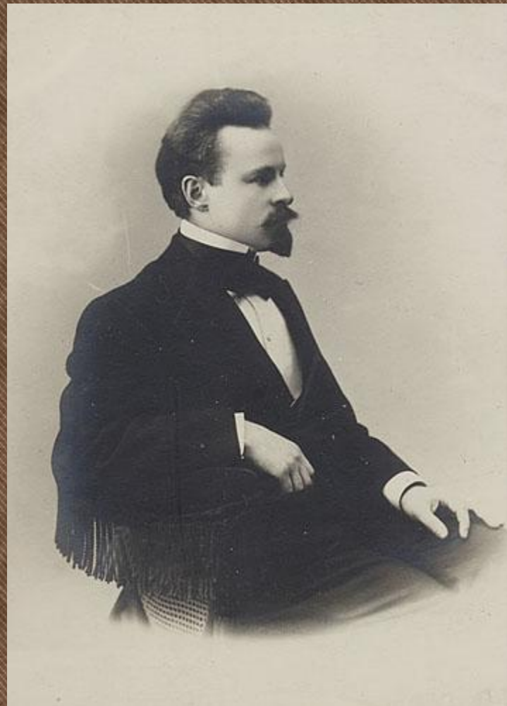
В.Я. Брюсов (1873-1924) К.Д. Бальмонт (1867-1942)