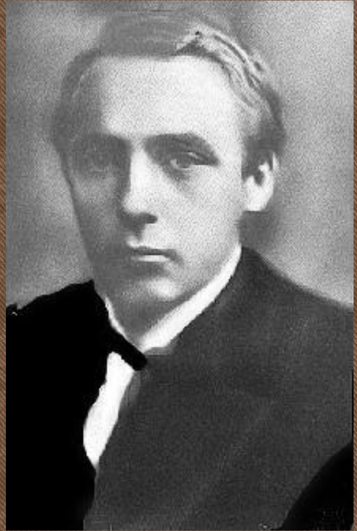
В.В. Хлебников (1885-1922)