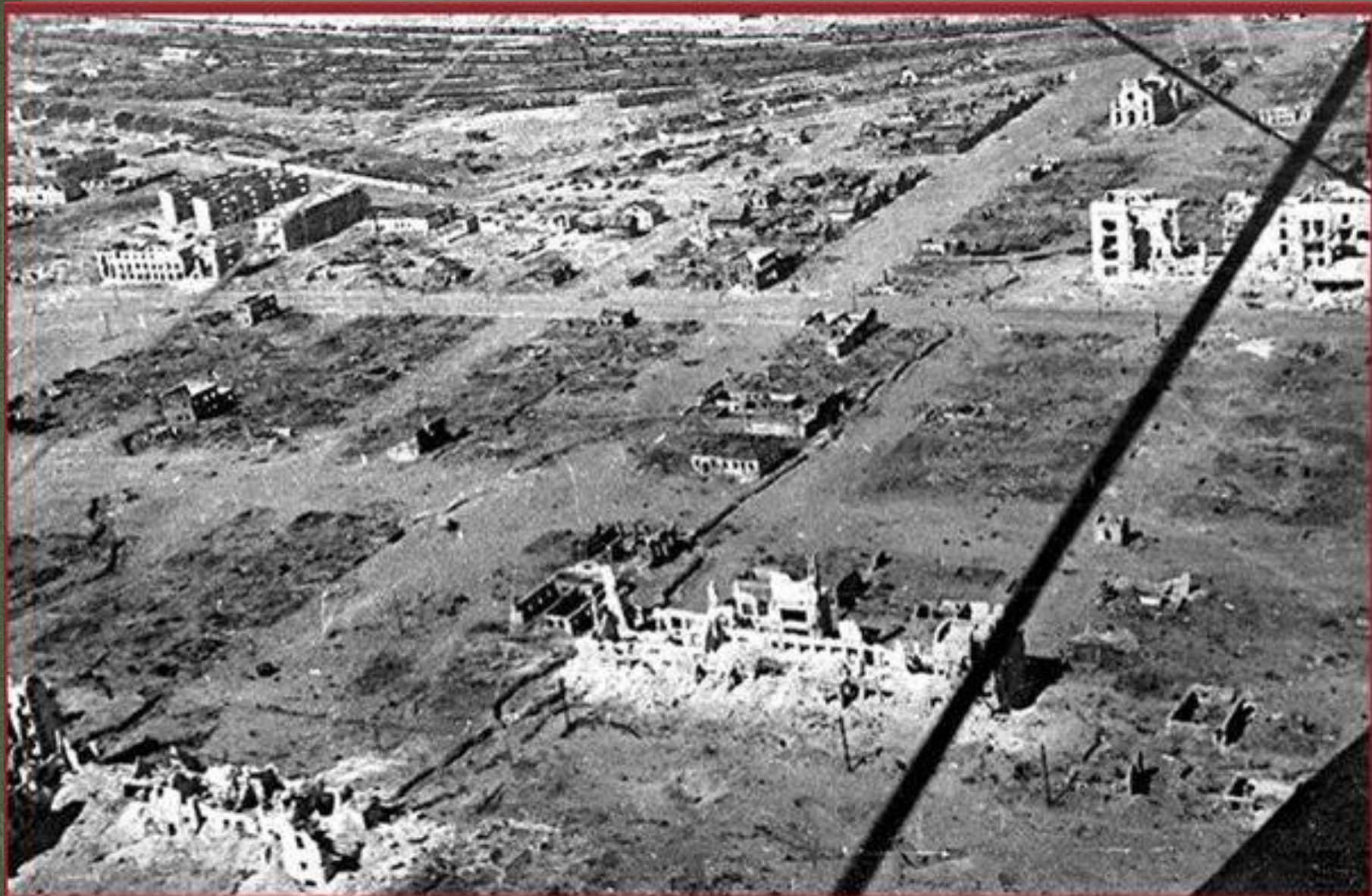
Участок от улицы Пражской до площади Ленина. Улица в центре - проспект Ленина