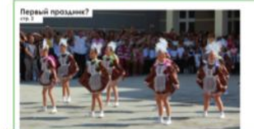
Первый продавец? стр. 1