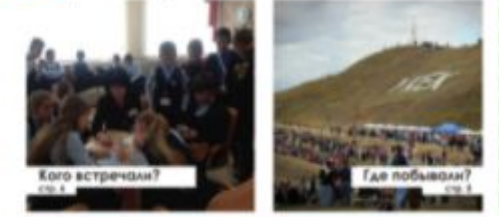
Кого встречали? стр. 4