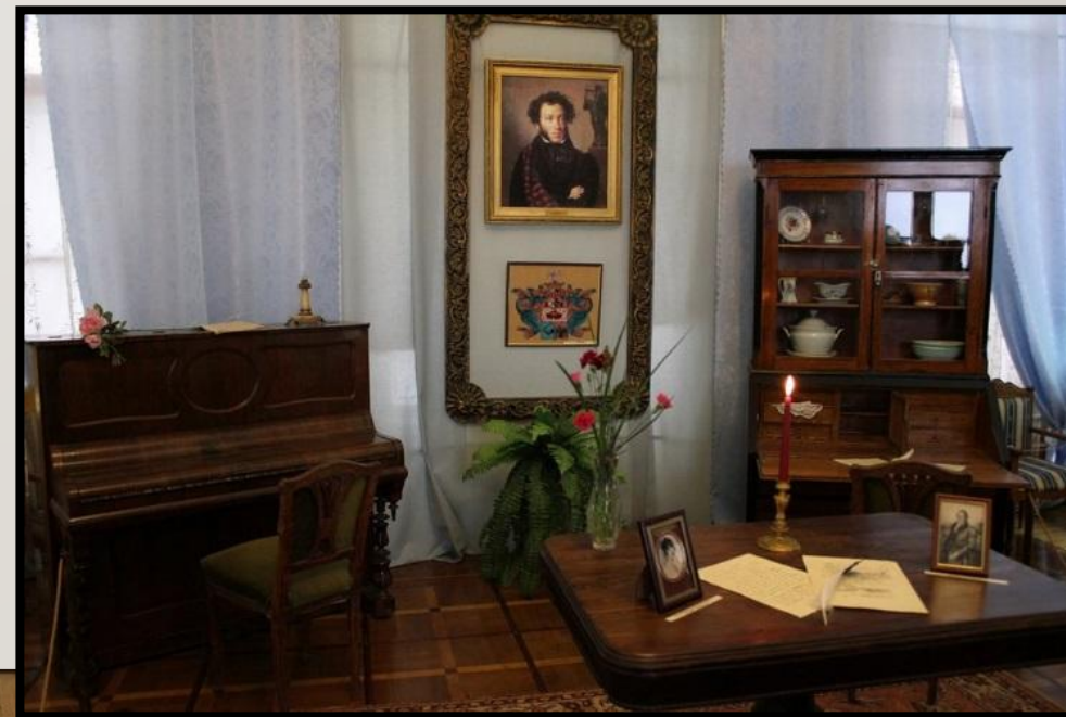
Музей А.С. Пушкину в Гурзуфе