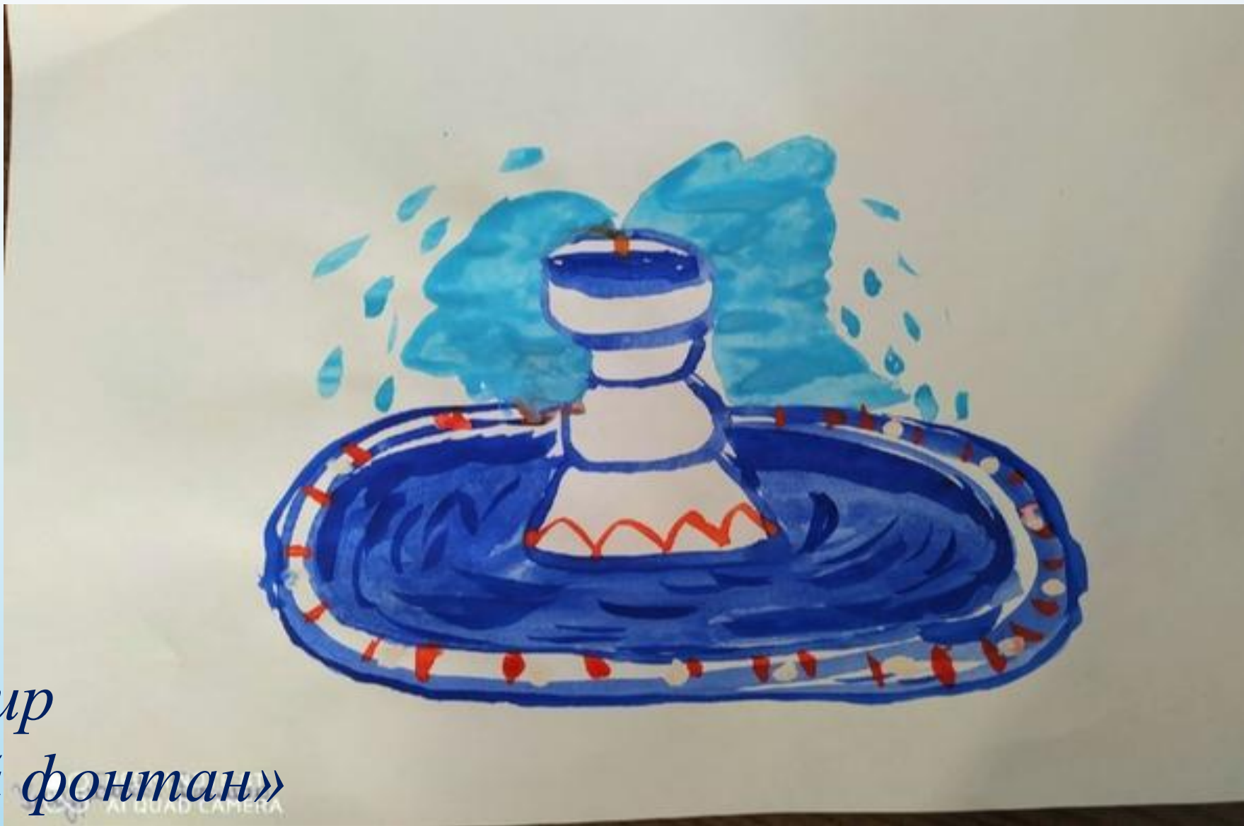
Умурбаев Дамир «Музыкальный фонтан»