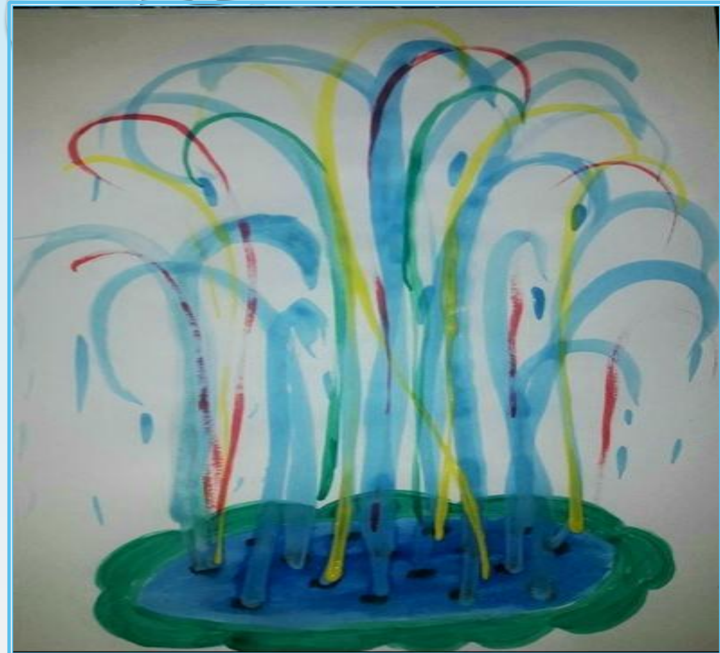
Иванова Ульяна «Музыкальный фонтан»