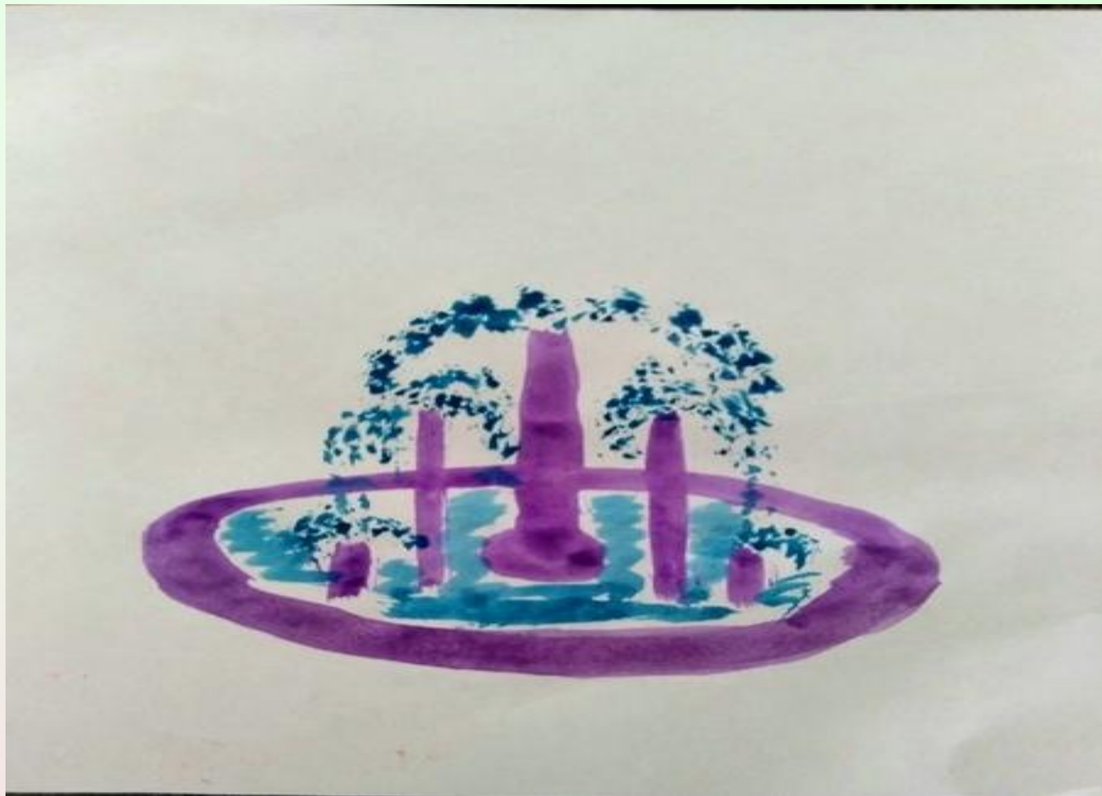
Петров Роман «Музыкальный фонтан»