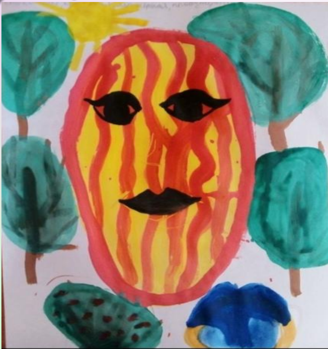
Габасова Аида «Образ весны»