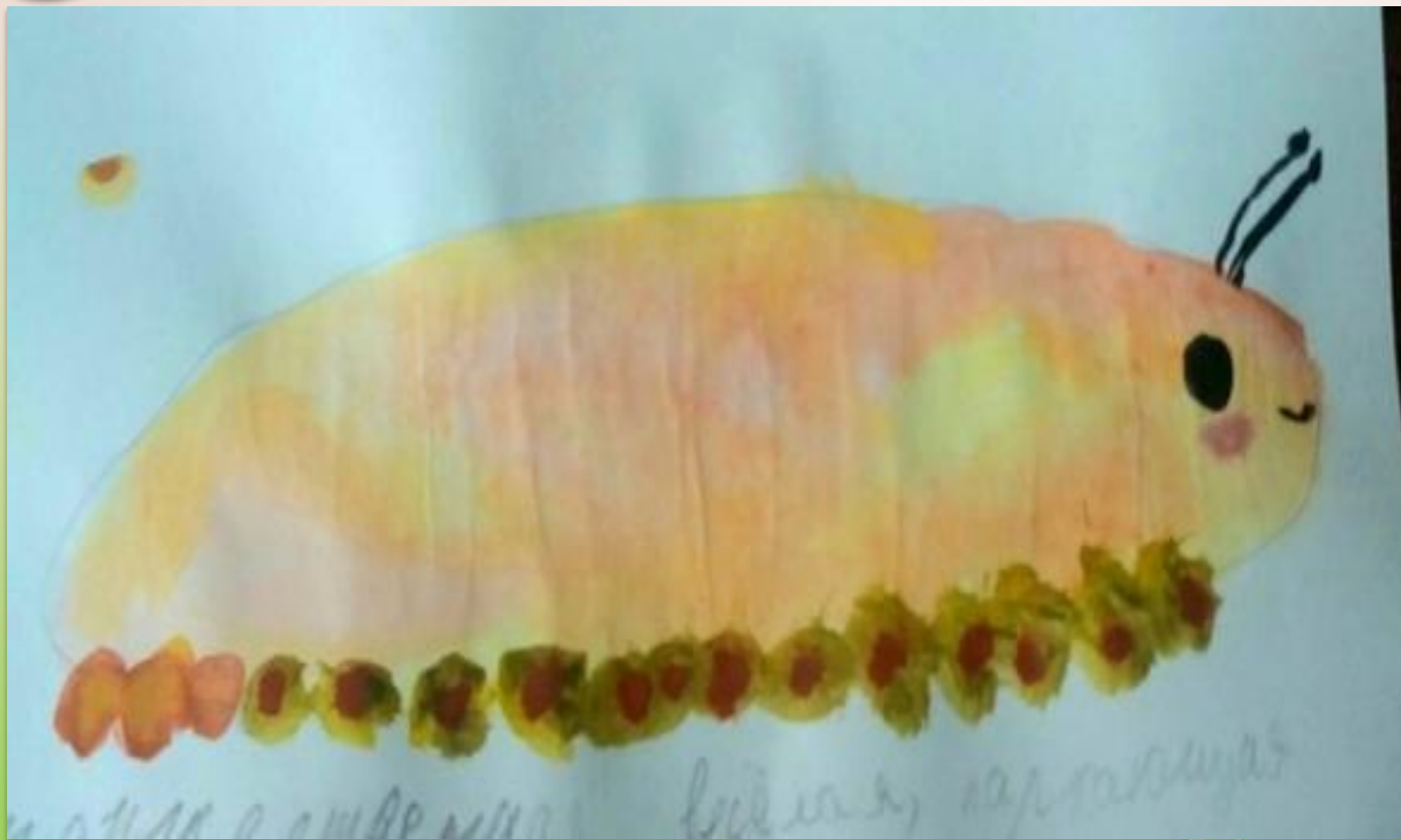
Ненюков Денис «Образ весны»