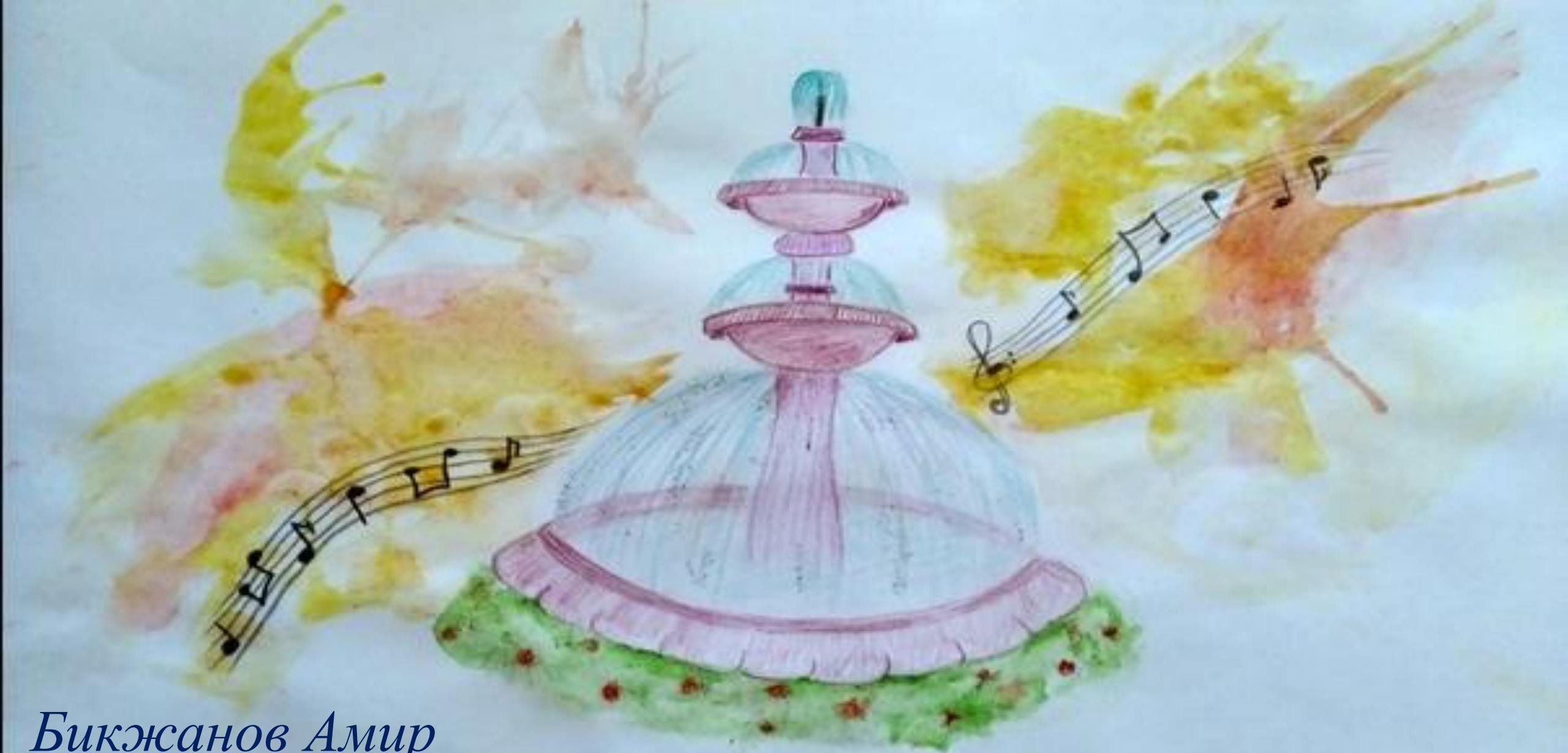
Бикжанов Амир «Музыкальный фонтан»