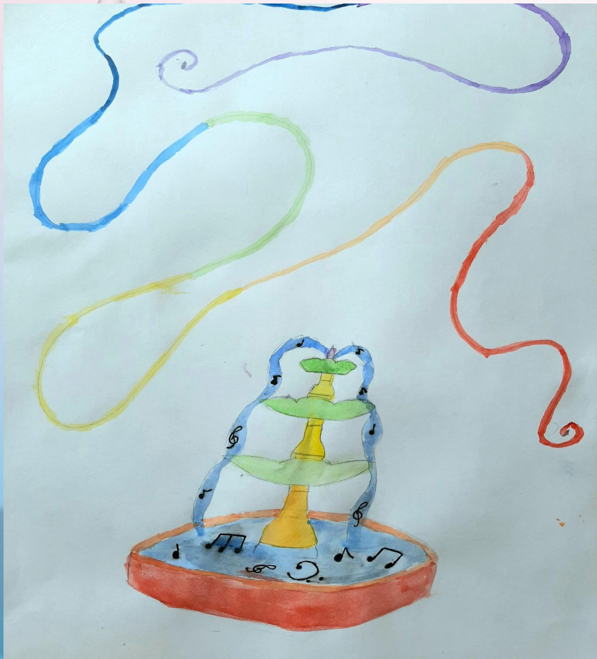
Антоненко Вероника «Музыкальный фонтан»