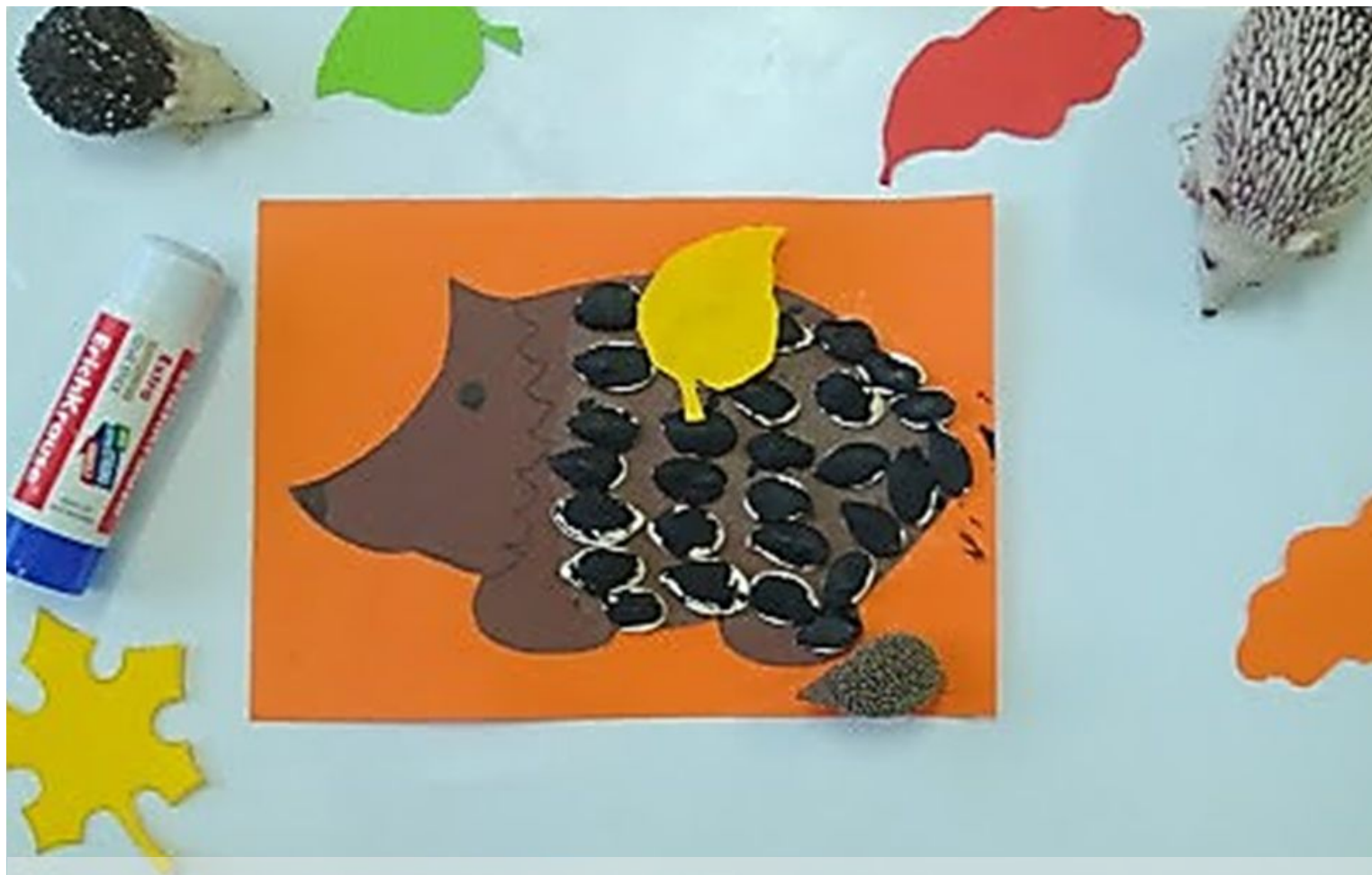
Поделка с использованием природного материала «Колочки для Ежика»